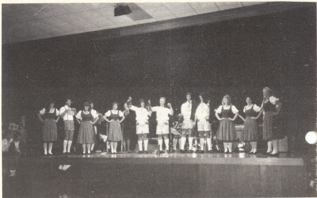
Skupina "Edelwise" so pokazali tudi nekaj novega na materinskem dnevu na Planici.