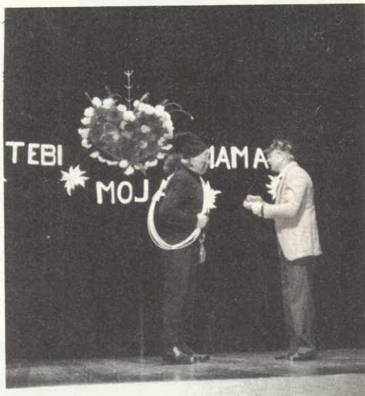
Proslava materinskega dneva učenci slov.šole in odrasli.