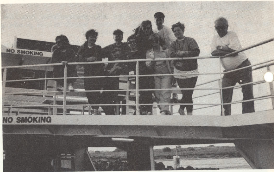
Iz izleta po Viktorji-Melbourne- Geelong-Melbourne.