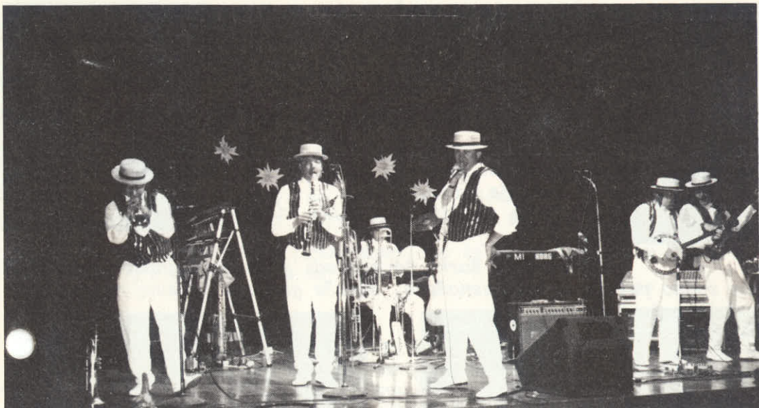
NASTOP SKUPINE "MÜRTZTALAR"