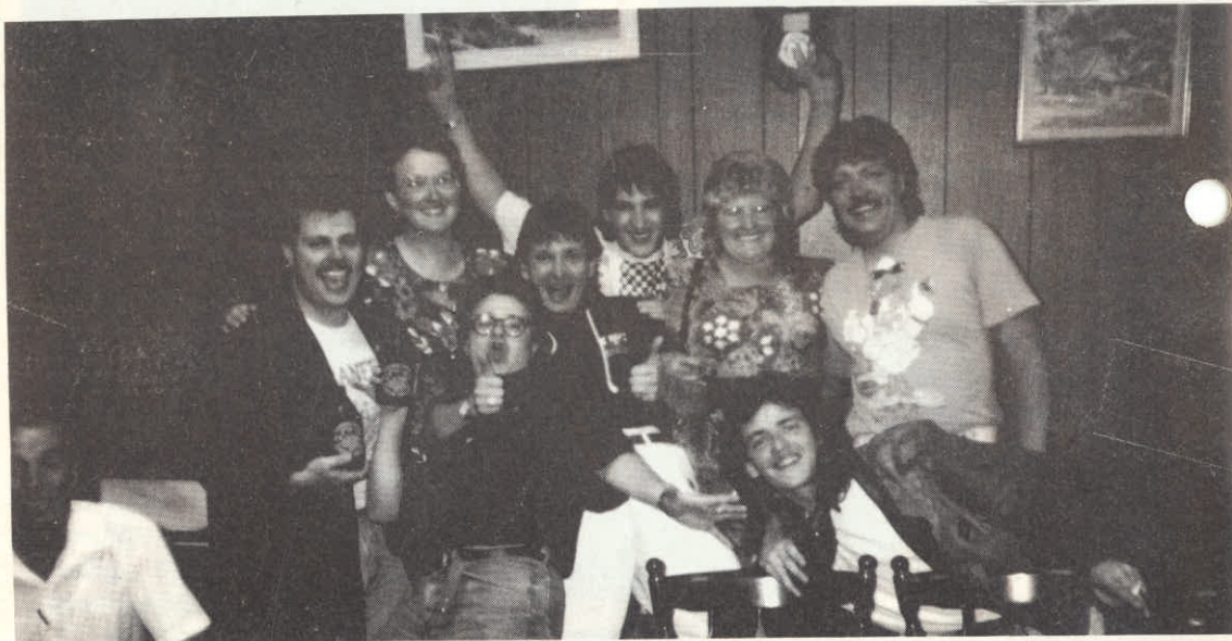
Kako se je lepo počutili mlad med mladimi.