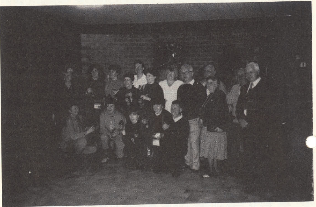
Topel sprejem Kolesark iz "Kamnika" na Planici.