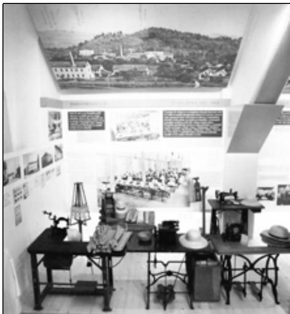
Utrinek z razstave v slamnikarskem muzeju.