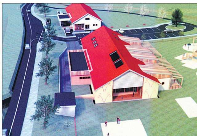
Takšna naj bi bila po idejni zasnovi nov završki vrtec (v ospredju) in zdravstveni dom.

Le nekaj metrov vstran od novega vrtca naj bi zgradili zdravstveni dom, za katerega je predvidena bruto površina okoli 200 kvadratnih metrov. Tudi ta objekt bo zgrajen sodobno, funkcionalno in energijsko varčno, v njem pa naj bi poleg ordinacije za zdravnika splošne prakse uredili še zo-