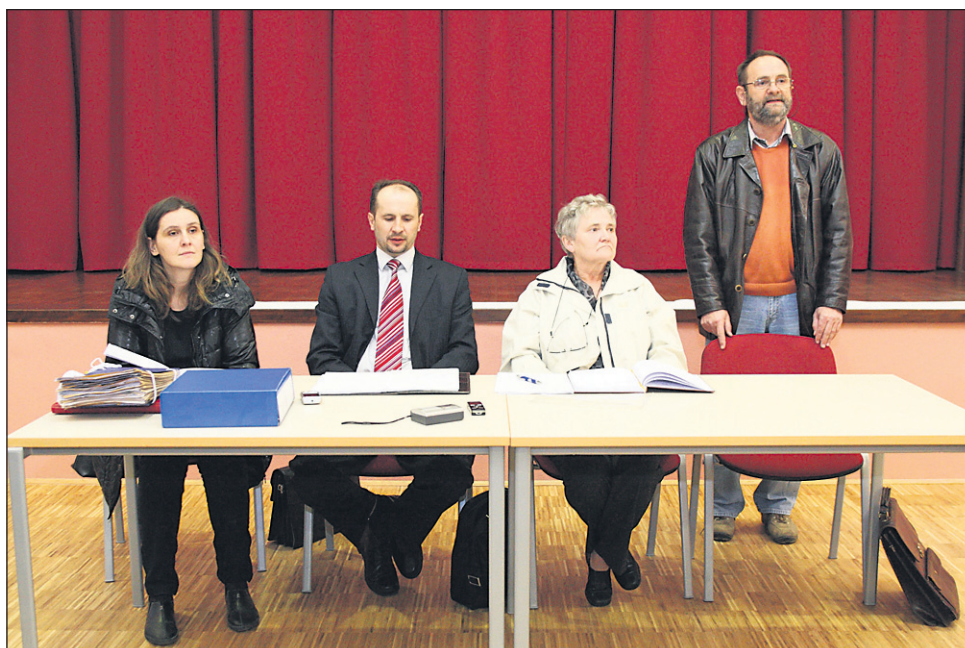
V ponedeljek so se v Domu krajanov Grajena zbrali predstavniki MO Ptuj, ČS Grajena in ČS Panorama ter lastniki zemljišč zaradi pridobitev še preostalih služnostnih pogodb za gradnjo primarnega kanalizacijskega voda.