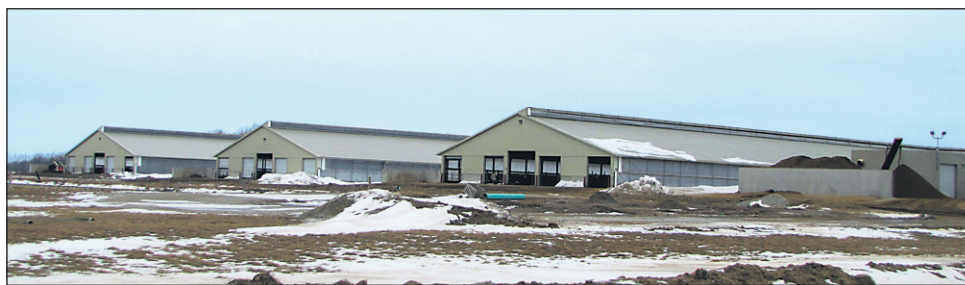
Trije izmed štirih velikih hlevov, v katerih imajo 3700 krav molznic.

Kmetija ima štiri velike hleve ter vse druge pripadajoče objekte. V hlevih imajo 3700 krav molznic, ki skupaj dajo dnevno kar 120.000 litrov mleka. Molzejo jih trikrat dnevno. Celoten postopek je avtomatiziran. Tako lahko hkrati molzejo 75 krav. Celoten proces molže traja 8 minut. Sama molža traja okoli 4,5 minute, preostali čas pa se porabi za pripra-