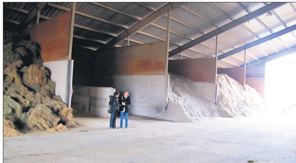
Na farmi sami pripravljajo krmne mešanice za svoje molznice.