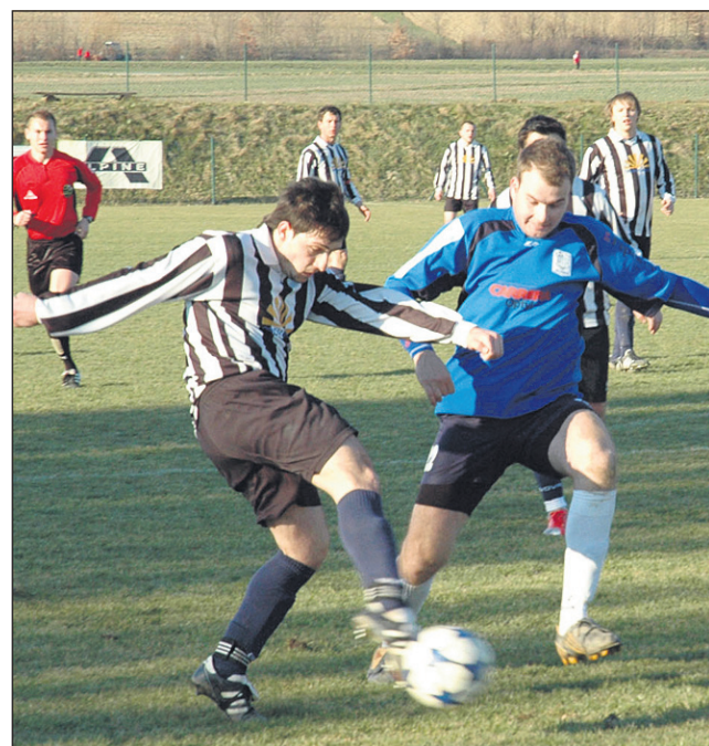
Nogometaši Carrere Optyla Ormoža (modri dres) so razočarali svoje pristaše in izgubili na domačem igrišču.

13. MONS CLAUD. 14 2 2 10 12:42 8 14. ZAVA GER. VAS 14 1 4 9 15:39 7