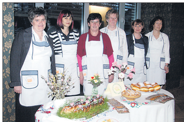
Za polne mize domačih sladkih dobrot so poskrbele članice Društva gospodinj iz Dražencev (na vrhu) in Društva podeželskih žena občine Markovci.