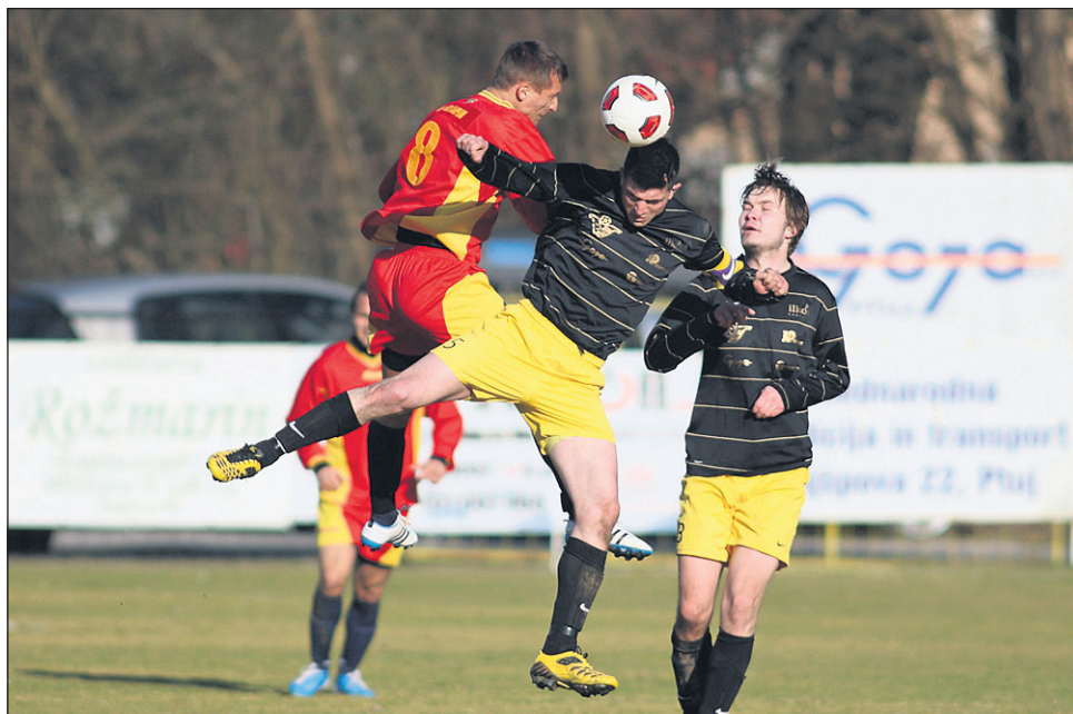
Nogometašem Stojncev (temni dresi) se ni posrečil uvod v spomladanski del prvenstva: s Simerjem šampionom so na domačem igrišču izgubili 0:4.

STRELEC: 1:0 Oluič (5.). AHA EMMI BISTRICA: Stegne, Novak, Hrušman (od 70. Mlinar), Hren, Danilovič, Korošec, Razbor-