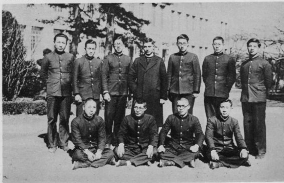
Novoustanovljena akademska Marijina družba na katoliškem vseučilišču v Tokio na Japonskem