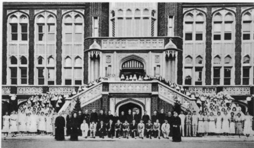
Tečaj Katoliške akcije za prednike in prednice Marijinih družb v New Orleans-u (U. S. A.) ob Mehiškem zalivu

»Pa drugo odložimo. Kar nerodno bi bilo, če nas zaloti kako deževje. Še tako bo gnoja premalo,« je razsojal Domačejkar, drobiž pa se je gnetel okrog njega, čakajoč na ukaz.