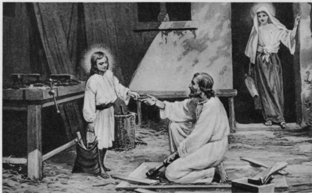
Sveta Družina (Jezus pri delu)

Dobili smo podrobnejša poročila o smrti almejrijskega in kadiškega škofa. Primorali so ju, da sta nakladala premog za oklopnico »Jaime I« in da sta polnila kotle med vožnjo. Če sta poskusila, da bi se za trenutek odpočila, so mornarji pomivali klopi in so ju zmočili. Čez nekaj dni so oba škofa skupaj z drugimi jetniki vrgli v morje.