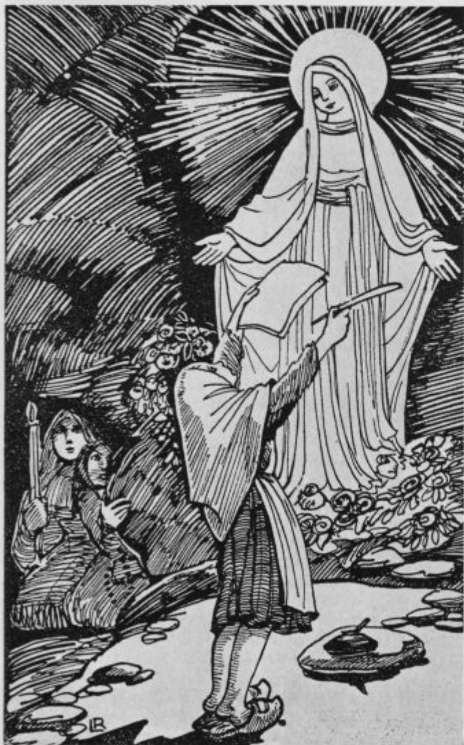
Sv. Bernardka: „Prosim, Gospa, zapiši, kako ti je ime!“

Jezusa pa smo dobili po Mariji. Kakor je bila božja volja, da nam je došel po Mariji, tako je njegova volja, da nam tudi vse njegove milosti dotekajo po njenih