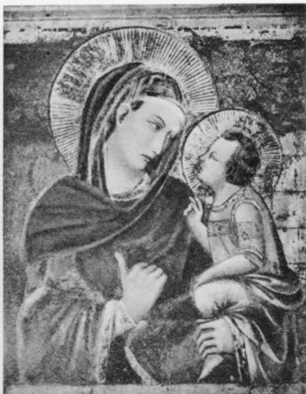
Mali Jezus uči svojo Mater