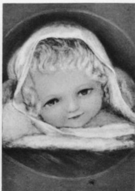
„Prikazala se je milost Boga, našega Odrešenika, vsem ljudem“ (Tit 2, 11.)

Junaštvo njegove matere ni bilo nič manjše. Ko je bil v ječi, je nekdo predlagal njegovi materi, naj ga pregovori, da bi prevzel tajniško mesto pri rdečem odboru. To bi mu rešilo življenje. Toda mati je odgovorila: