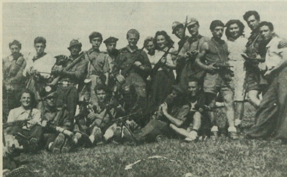
Skupina partizanov v Venetu

je vračala šole in jezik, toda prinašala je novo nestrpnost. Tirolski Nemci niso sprejemali nacizma, razen nekdanjih optantov, ker je imel v sebi nekaj poganškega, tujega globoki katoliški veri teh ljudi. Tako so zapuščali rusko fronto, se skrivali po hribih, sabotirali transporte in končno organizirali skupino «Andreas Hofer Bund», ki se je borila za avtonomijo male tirolske domovine sredi Evrope in je pri tem odločilno pomagala zavezniko, ki so imeli svoje radijske centre v Švici.