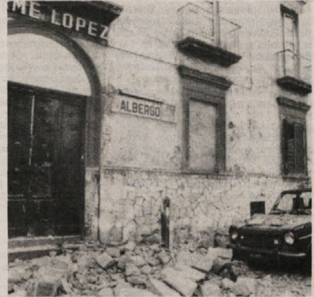
Dva, žal precej običajna, prizora iz potresnega Pozzuolija