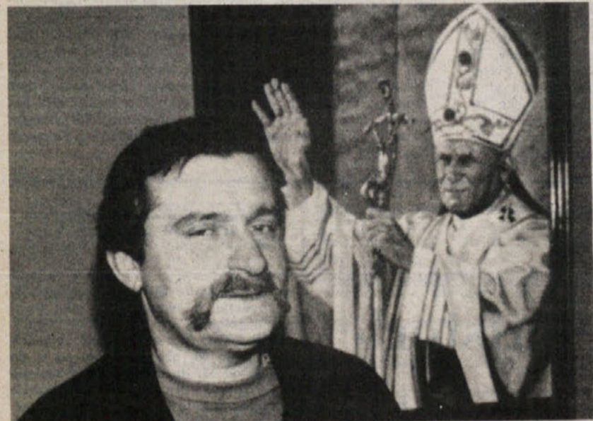
OSLO — Predsednik razpuščenega poljskega sindikata Solidarnost Lech Walesa je letošnji Nobelov nagra-

nec za mir. Norveški odbor, ki podeljuje priznanja, je izbral Waleso med številnimi drugimi kandidati, med