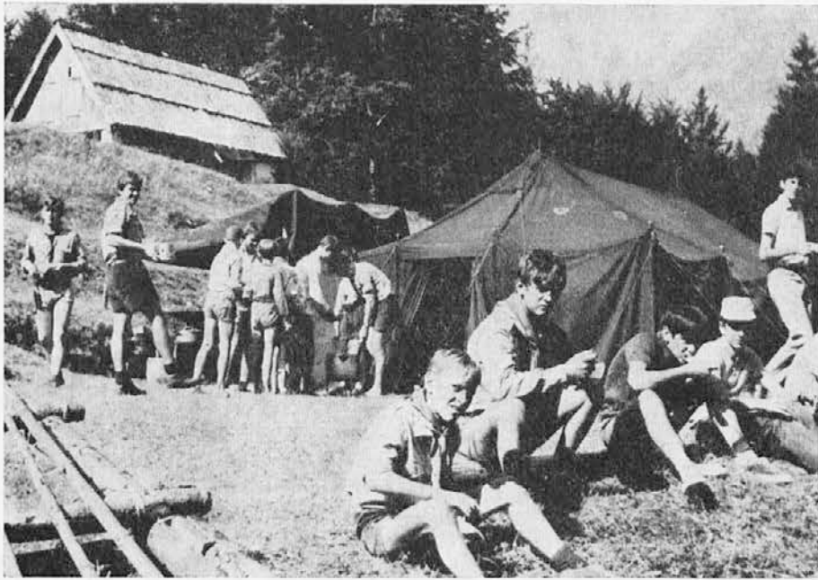
Prizor iz taborjenja slov. goriških skavtov pod Mangrtom, ki se je zaključilo 29. julija