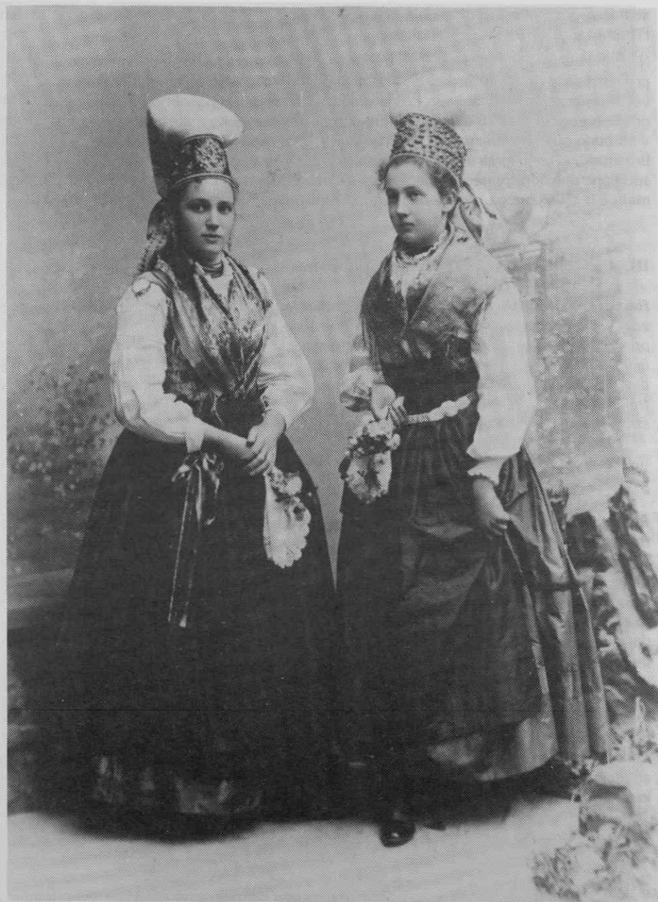
Sl. 10. Ženska narodna noša, Kamnik, leta 1894