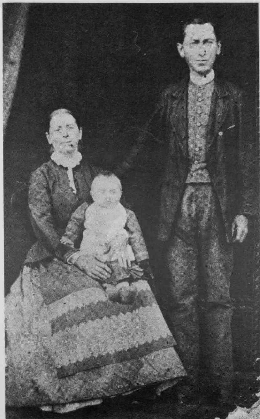
Sl. 13. Pražnje oblečena družina z velike kmetije, Sovjak, leta 1885