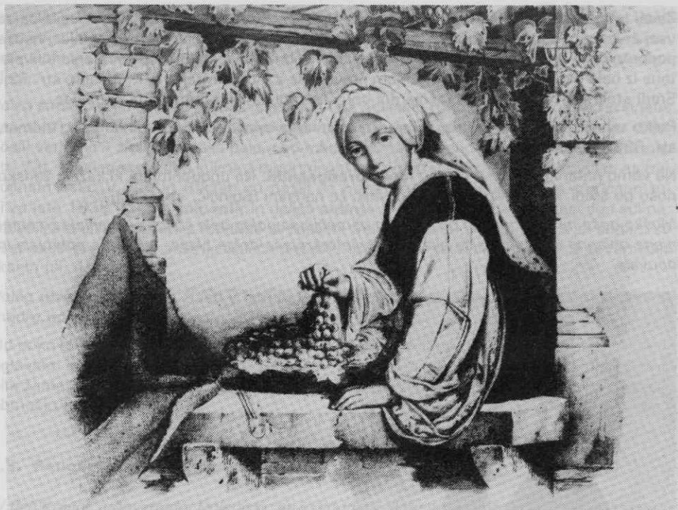
Sl. 3. Kmečka ženska pražnja noša, Škedenj pri Trstu, leta 1842 (Kandler)

je spredaj po vsej dolžini prerezano oblačilo, krojeno iz belega, rjavega ali črnega platna in tudi bombažnega blaga. Oblačilo, ki je v ramenih široko krojeno, ima prav tako kot srajca zadaj klinast vstavek. Zato je zadnja stran precej širša od prednjih dveh. Posebnost belih in temnih kamižotov pa je drobno ročno gubanje, ki teče nekako od srede hrbta navzdol (npr. SEM, inv. št. 5949).