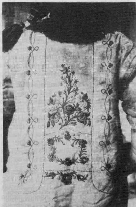
Sl. 16. Z raznobarvno volno vezen moški kožuh, Gorenjsko, sreda 19. stoletja, (SEM)

Če povemo še drugače: po celotredenskem garanju in nemalokrat tudi umazanem delu so ljudje v agrarnem okolju le ob nedeljah in praznikih počivali in počitek oznamovali tudi s snažno praznjo obleko. Ali kot je bilo slikoviteje zapisano leta 1873: „O praznikih mora vse čisto i doljne kikle... delavnik je kmet, praznik gospod, 6 dni v dreku, blatu, 1 dan v škrlatu in zlatu“ (Trdina II, str. 535–536). Peščica veljavnejših pričevanj o stanovanjski kulturi in higieni (gl. tudi Keršič) nam obenem govori tudi o oblačilni in osebni higieni. Ta je