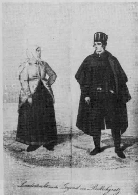
Sl. 17. Kmečka zimska ženska in praznja noša, Polhov gradec, Dobrovo, Vrhnika, leta 1838, (Goldenstein)

Sredi 19. stoletja so različna pokrivala še vedno, zlasti v panonskem oblačilnem območju označevala zakonski stan žensk. Peča, ki naj bi bila nekdanj samo pokrivalo zakonskih žena (Ložar, Noša, str. 228), je do srede 19. stoletja ta pomen v glavnem že izgubila. Vsaj tako sklepamo po pomanjkanju pričevanj v tej zadevi. Izjemo pomeni pesem s Štajer-