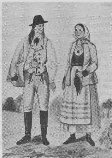
Sl. 9. Kmečka moška in ženska pražnja noša, Mokrice, leta 1870 (Arsenovič)

daljšo brezrokavno suknjo, zobunom , iz belega sukna, npr. v Osilnici 1838 (Kordesch, str. 320). Za moško nošo v Poljanski dolini ob Kolpi je značilno posebno pokrivalo, rdeča in okrašena kapa (sl. 6). Posebna noša ženitovanjskega zastavnika v Poljanski dolini je izpričana predvsem z rdečim suknenim plaščem, in že omenjeno rdečo kapo in dolgimi belimi suknenimi oprjetimi hlačami (Kordesch, str. 212). Moška zimska noša s škornji, belimi suknenimi hlačami in belo sukneno suknjo iz okolice Brežic okoli leta 1811, je tudi še kasneje značilna zimska noša na širšem območju (Russ, sl. 9); le da so npr. v pokrajini med Dravo in Muro ter v Prekmurju značilni iz belega sukna po madžarski šegi krojeni plašči, suknje in suknjiči (Goldenstein, sl. 66).