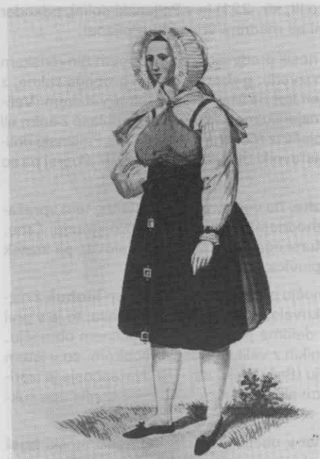
Sl. 7. Kmečka ženska pražnja noša, Zilja, leta 1838 (Goldenstein)