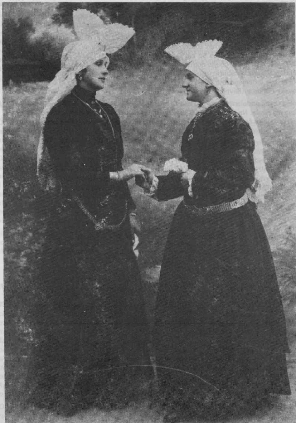
Sl. 11. Ženska noša ob večjih praznikih, Moste pri Ljubljani, konec 19. stoletja