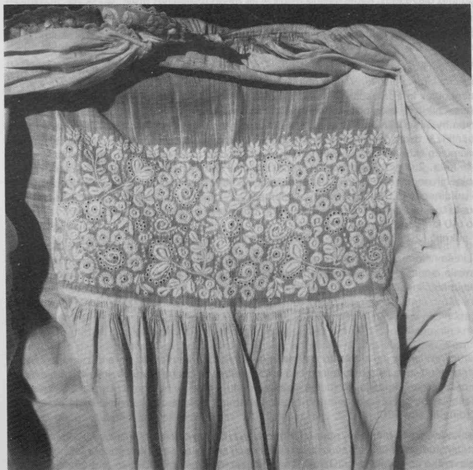
Sl. 15. Vezenina na ramenskem delu ženskih praznjih rokavcev, okolica Trsta, konec 19. stoletja, (SEM)

Nedeljam in praznikom, ki so bili v 19. stoletju povezani s splošnejšo udeležbo pri nedeljskih in prazničnih mašah, je bila namenjena posebna praznja ali semanja obleka (Novičar, str. 139). Ta se je vsaj po snažnosti in kakovostnejšem blagu razločevala od vsakdanje. Kot je bilo že v drugi zvezi povedano, je bila ponekod nedeljska obleka vsaj pri mlajših vaščanih naprednejša, sodobnejša oblika noše. Pri starejših ljudeh, ki so zaradi