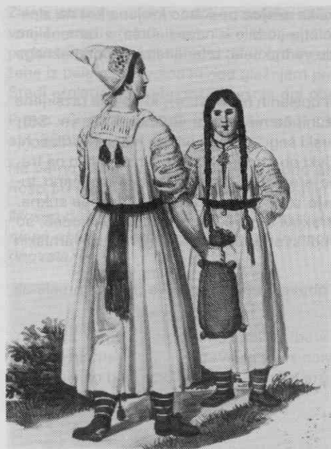
Sl. 5. Kmečka ženska pražnja noša, Poljanska dolina ob Kolpi leta 1838 (Goldenstein)

krojene rokavce oblačile tudi ženske na vzhodnem Slovenskem Štajerskem, le da so bili vsaj za pražnje dni iz perkala (Baš, Opisi, str. 18). Ponekod na Štajerskem (Ormož) so si ženske rokavce pod vratom zavezovale z rdečimi trakovi.