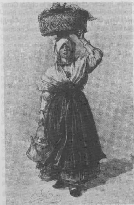
Sl. 8. Pražnja noša tržaške okoličanke, prva polovica 19. stoletja