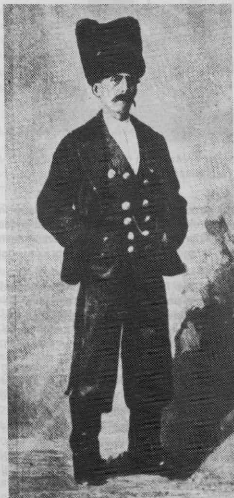
Sl. 4. Kmečka moška pražnja noša, Škedenj pri Trstu, sreda 19. stoletja

Moško nošo na primorskem oblačilnem območju so poleg bele srajce sestavljale že omejnene ohlapno krojene krajše hlače in oprijeto krojene dolge hlače, ter razna pokrivala in obuvala.