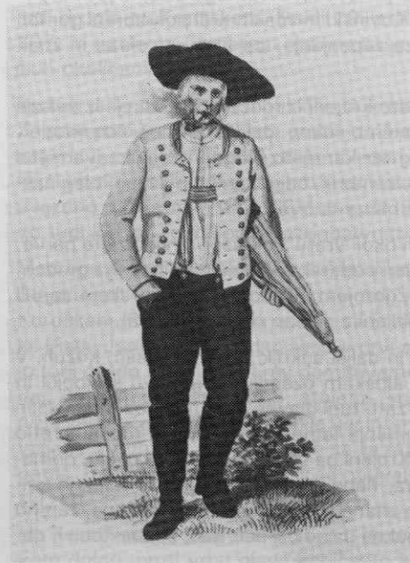
Sl. 2. Kmečka moška pražnja noša, Smladnik, leta 1842 (Goldenstein)

Moško nošo sestavljajo poleg srajce, kratkih dokolenskih oziroma podkolenskih hlač in telovnika razna pokrivala, obuvala in druga dopolnila. Večje razlike med moškimi nošami so v glavnem le v hlačnih krojih. V večjem delu alpskega oblačilnega območja so bile v navadi oprijeto krojene hlače, pri mandrjerih v tržaški okolici pa podobno kot v Slovenski Istri ohlapno, hlamudravo krojene hlače.