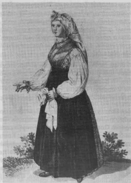
Sl. 1. Kmečka ženska pražnja noša, Škofja Loka, leta 1838 (Goldenstein)

O krojih spodnjih kril so poučnejša ohranjena krila iz druge polovice 19. stoletja. To so na pas krojena in v pasu drobno nabrana krila iz grobega ali finejšega domačega platna in tudi iz kupljenih belih bombažnih tkanin; pražnja so okrašena z belo ročno ali strojno vezeni- no, ročnimi ali strojnimi čipkami.