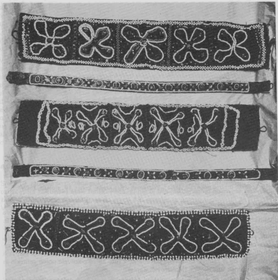
Sl. 19. Okrasni ženski čelni trakovi „parte“, Bela krajina, druga polovica 19. stoletja, (SEM)

na lajbelc (mala kamižola) in pa černe škornje. Ženske pa imajo bele janke (kikle), černe predpasnike (Szhurze) in rudeče robce okoli vrata“ (Žurman, str. 30).