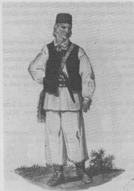
Sl. 6. Kmečka moška praznja noša, Stari trg ob Kolpi, leta 1838 (Goldenstein)

Drugi podatki o tem so premalo natančni, ker posplošeno omenjajo samo „široke“ hlače (npr. Velika N.). Kar zadeva dolžino hlač so Belokranjcem segale čez meča (sl. 6), prebivalcev Ptujskega polja do gležnjev (Baš, Opisi, str. 22), Pesničarjem pa do kolen (Baš, Opisi, str. 22). V večjem delu panonskega oblačilnega območja so nosili pozimi tudi dolge oprijete hlače iz belega sukna (npr. Krupa, Poljane, Kostanjevica, Ormož), v Prlekiji (Baš, Opisi, str. 29) in Prekmurju (Csaplovics, str. 76) so nosili modre hlače in v jugovzhodnem delu Slovenskih goric tudi črne (Hrastovec: Dolanci). Tako kot smo videli že pri istrski moški noši, so bile hlače ob stranskih robovih in spredaj na trebuhu okrasno pošite, na primer v Poljanski dolini z zelenim ali modrim (Poljane) in v čateški občini z rdečim ali modrim trakom (Kostanjevica).