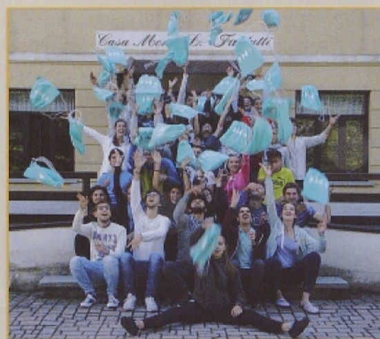
Projekt DEVELOPMENT+ v Lužicah

Ko pa se ista situacija spet in spet ponavlja, se začneš spraševati, če je resnični problem čas ali morda kaj drugega. Ko smo si z drugimi tremi