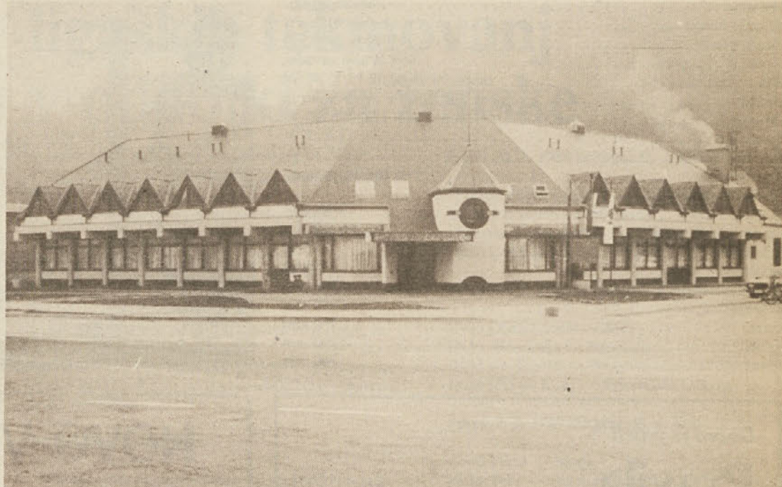
Eden izmed dosežkov na področju gostinsko turistične dejavnosti v zadnjih letih je tudi izgradnja hotela Hum v Laškem, v katerem je bilo delovno posvetovanje najodgovornejših gostinsko turističnih delavcev