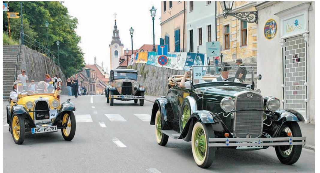
Naše mesto je čudovita kulisa srečanj starodobnikov, med katerimi smo občudovali tudi Ford A roadster de lux in Ford A - oba z letnico izdelave 1930 in živahno rumenega Aero 10 cabrio, letnik 1931.