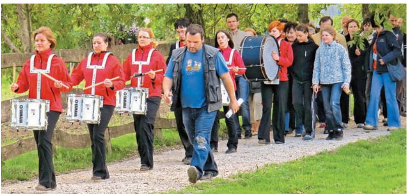
Svečana povorka je zaobjela Perovo, Perovljane in Kamničane.