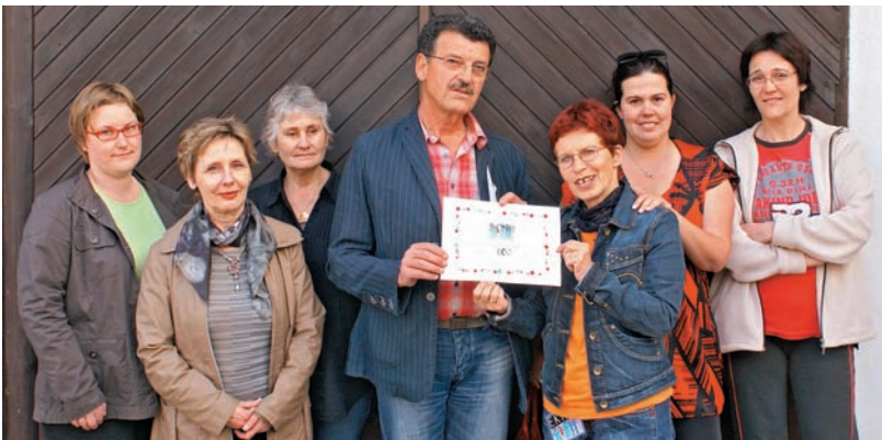
Za vas dobitna srečka, za perovsko družino 600 evrov.