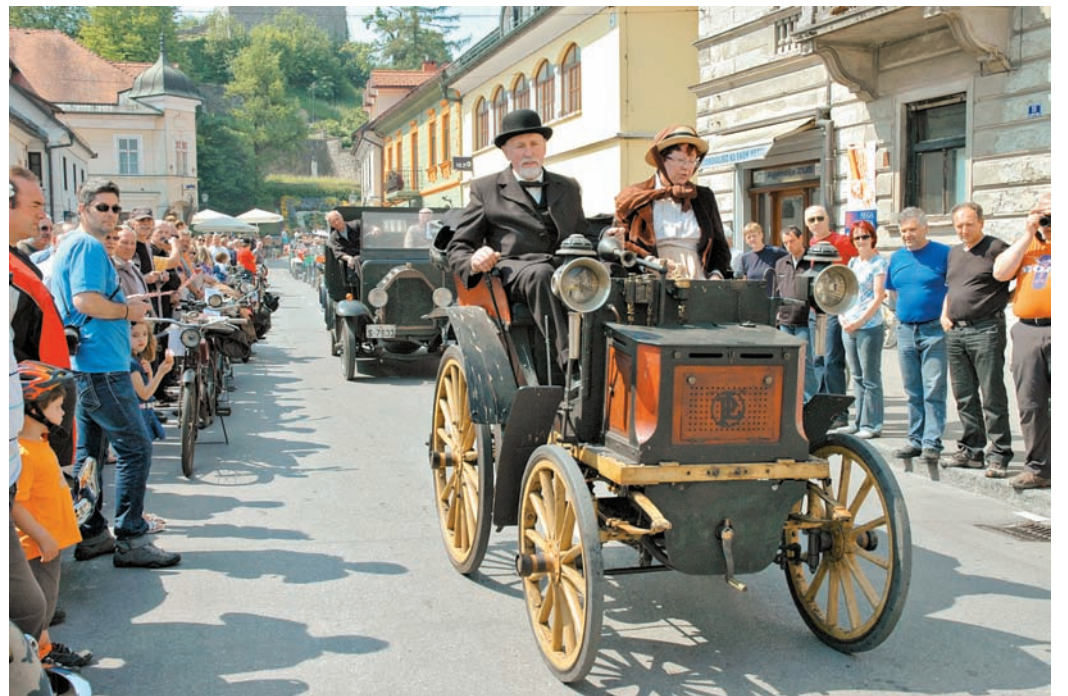
Najstarejše vozilo je v Kamnik pripeljalo z Madžarske – znameniti Panhard Vagonette s častitljivo letnico izdelave 1897 je na svetu še edini te znamke v voznem stanju.