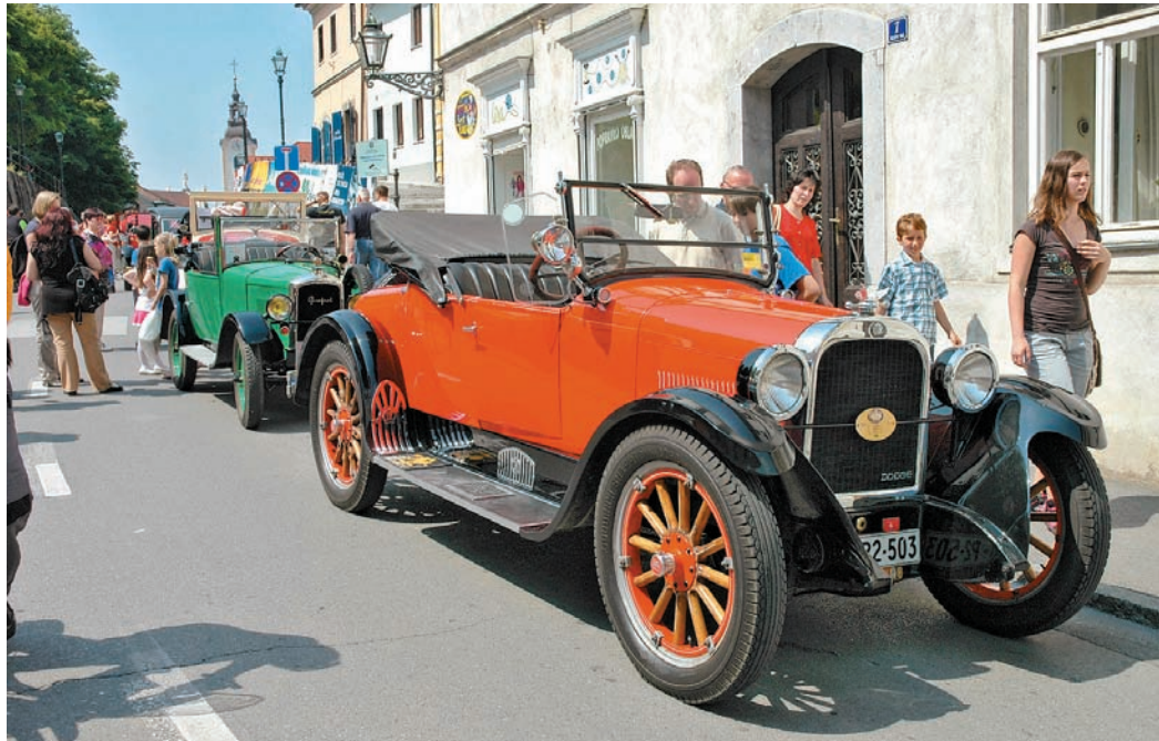
Odlčno ohranjen Dodge roadster, letnik 1924, je pritegnil veliko pozornosti obiskovalcev.

Minulo soboto, 21. maja, smo na ulicah našega mesta in v Arboretumu Volčji Potok ponovno imeli priložnost občudovati bogato tehnično dediščino - automobile in motorje, ki po letu izdelave sodijo v obdobje pred drugo svetovno vojno in se v pravem pomenu besede ponašajo z nazivom starodobniki. Društvo starodobnih vozil Kamnik je z 2. mednarodno revijo starodobnikov »A« počastilo desetletnico svojega delovanja.