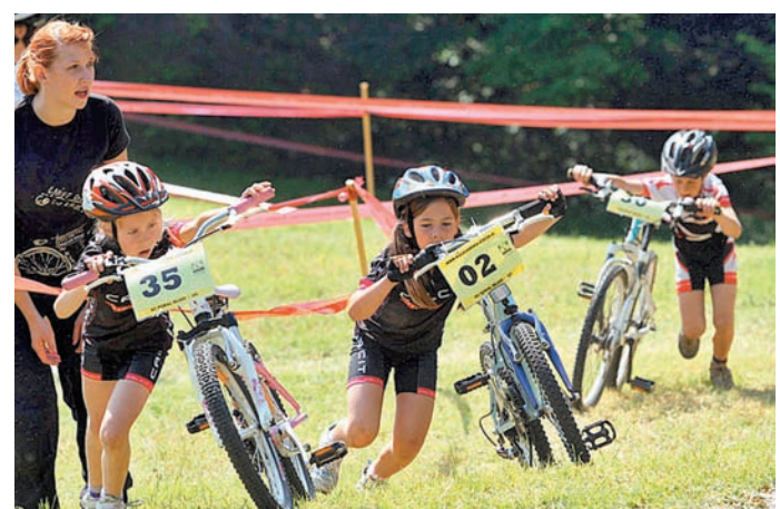
Takole vztrajni so bili tekmovalci v najmlajših kategorijah