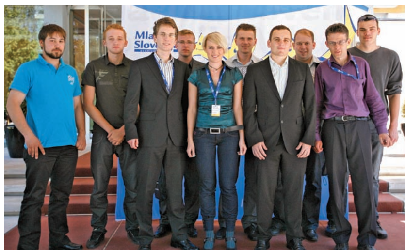
Udeleženci, ki so na kongresu zastopali Kamnik

Mlada Slovenija je s kongresom združila tudi praznovanje