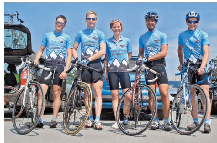
Ekipa KD Alpe uspešno začena sezono.

Prvi vrhunec sezone sledi konec maja, ko bo v Murski Soboti potekalo državno prvenstvo v cestni vožnji na težavni in selektivni krožni prog. V društvu so mnenja, da je, po številnih osvojenih drugih in tretjih mestih, napočil čas, da nekdo izmed članov KD Alpe obleče cenjeno majico državnega prvaka v barvah slovenske trobojnice.