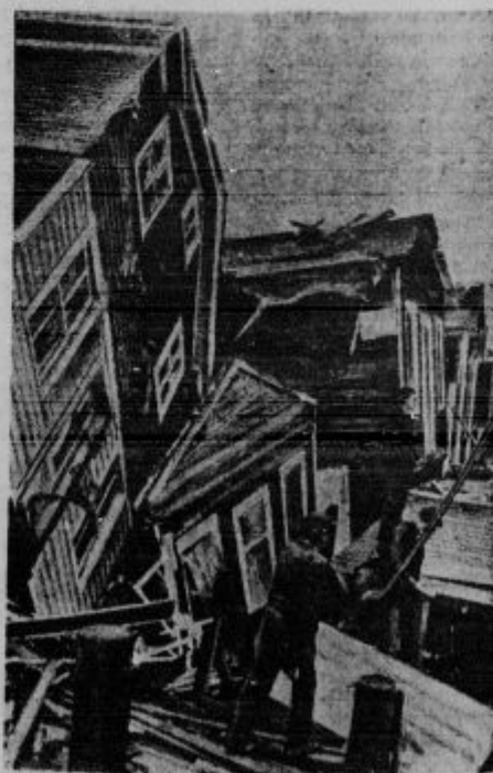
Tornado pustoši po Ameriki.

Misijska postaja v Vindhuku v Južnozpadni Afriki, obstoji iz velikega avtomobila, ki je tako preurejen, da lahko nosi s seboj oltar in majhen harmonij. Misionarji se s tem avtomobilom vozijo iz kraja v kraj, na njem mašujejo in iz njega pridigajo črncem, ki prisostvu-jejo službi božji z veliko gorečnostjo.