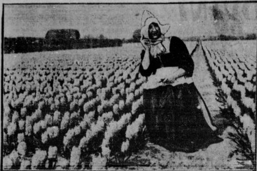
Maaija uničevanja blaga.

Radi prevelikega obilja hijacintnih pridelkov na Nizozemskem je precej padla cena tem produktom in gospodarstveniki se hočejo rešiti iz te »krize« na ta način, da bodo uničili nad 20 milijonov hijacintnih čebul. S tem se bo cena hijacint »popravljal«, svet pa bo za eno nemoralno početje bogatejši.