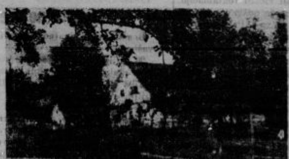
Andrejkov dom v Dolenjah (pri Hudmanu). Pogled z obč. ceste

marveč da so davni dedje prišli iz Slovaškega ali celo iz Rusinskega kot prevozniki in da so se naselili ob veliki cesti okoli Prevoj in St. Vida. Čudno je vsekakor, da tega imena ni nikjer drugod po Slovenskem, da ga pa najdemo zelo pogosto v rusinskih pokrajinah, o čemer sem se sam prepričal, ko sem bil l. 1912. na študijskem potovanju v Lvovu, glavnem mestu tedanje Gališke, kjer sem to ime, in sicer natanko ime Andrejka bral nad več irgovinami.