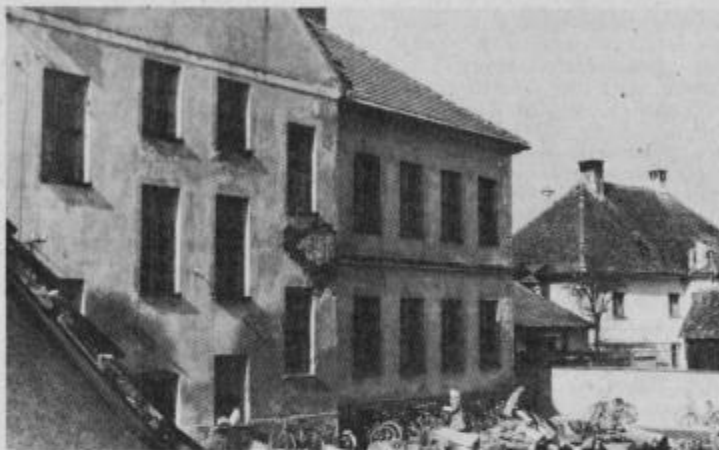
Takšen je pogled na 83 let staro šolsko zgradbo v Markovcih, ki „nudi streho“ nad 500 učencem tega kraja in okolice.

bosta morala naš otrok in učitelj še dati časa trpeti v utesnjeni šoli? Indeks obremenjenosti stavbe je 320 glede na poprečno otrok po oddelkih v občini in republiki. Kljub težavam pa naši otroci in učitelji le dosegajo lepe uspehe. V lanskem šolskem letu je bil učni uspeh 95,1 %, kar je v teh