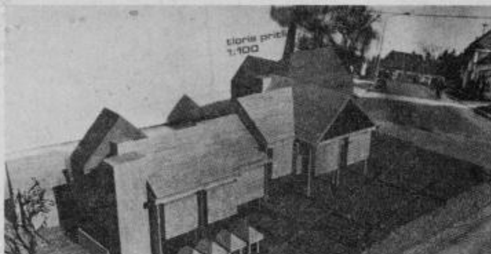
Maketa nove blagovnice, ki bo zrastle na Mestnem trgu v Ormožu tam, kjer sedaj stoji Zarjina prodajalna „Steklo-barve“. (Ptičja perspektiva iz severovzhodne strani).

V občini Slov. Bistrica se zavzamejo tudi za povezovanje in združevanje KS v skupnosti KS, kar bo zahtevalo od vseh nova skupna prizadevanja in solidarnost vseh krajanov. VH