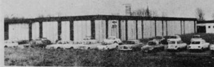
Tako smo ujeli v objektiv nove proizvodne prostore TOZD Delta Ptuj v Rogoznici, tik po otvoritvi.

Kapacitete pomožnih prostorov in energetskega objekta so zgrajene po programu, ki obsega 6.000 kvadratnih metrov tovarniških prostorov v katerih bo lahko delalo okoli 600 delavk. Stroški te investicije so skupaj s pripravami in komunalijami znašali 15.037.000 din. Druga etapa gradnje bo torej obsegala še 2.500 kvadratnih metrov in pomeni ponovitev proizvodne dvorane, del skladišča in upravni del.