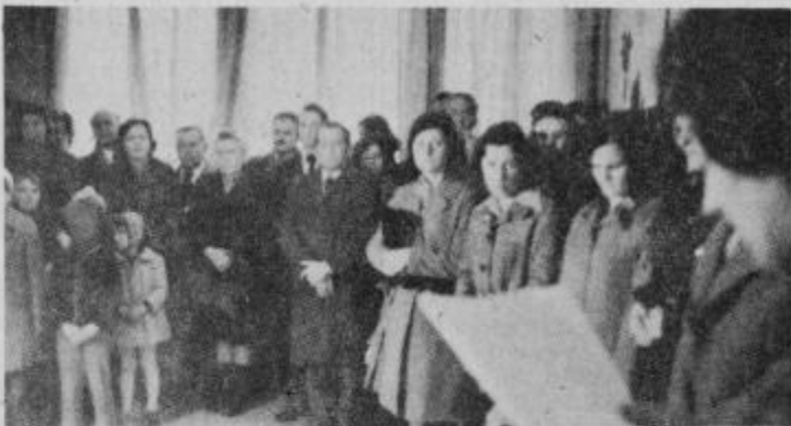
Del udeležencev otvoritve vrtca pri Veliki Nedelji

Otroci so srečno živeli v varstvu svojih vzgojiteljic, ki so s tankim posluhom skrbele za njihov čustveni in miselni svet, ko so jih vodile v otroški svet lepote in resnice, ko so s pravljičami burle njih domišljijo in z njo budile prvo otroško ustvarjal-