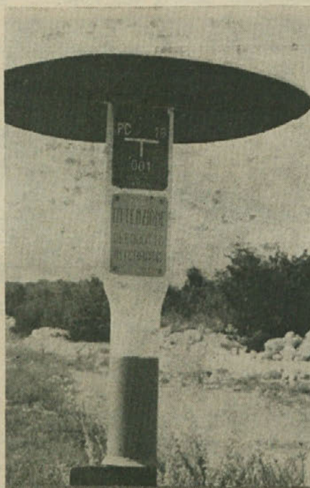
Znamenje z napisom, ki opozarja, da je preko Krasa speljan naftovod. Sedaj nameravajo zgraditi še tri naftovode.

Komunisti še enkrat poudarjamo, da tudi stališče dveh občin, kjer ima besedo SS, ne bo okrnilo enotne fronte, ki se je ustvarila med delavstvom in drugimi gospodarskimi krogi, proti «naftnemu pristanišču» v Trstu. Saj gre za perspektive splošnega razvoja naših ljudi!