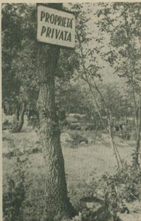
Tako mestna gospoda «ščiti» podobno Krasa...

Končni cilj, ki si ga postavljamo pa je sledeči: Slovenci, ki smo kot narodna manjšina, nosilci specifičnih interesov v okviru splošnih razvojnih zahtev tržaškega področja in dežele Furlanije-Juljske krajine, moramo biti soudeleženi , ko gre za načrtovanje novih del, novih gospodarskih izbir in pobud. Skratka, da smo Slovenci in delavski razred soudeleženi pri «demokratičnem načrtovanju» , kar je seveda v popolnem nasprotju s težnjami vodilnega političnega razreda, ki hoče samovoljno ukazovati in urejati stvari v lastno korist.