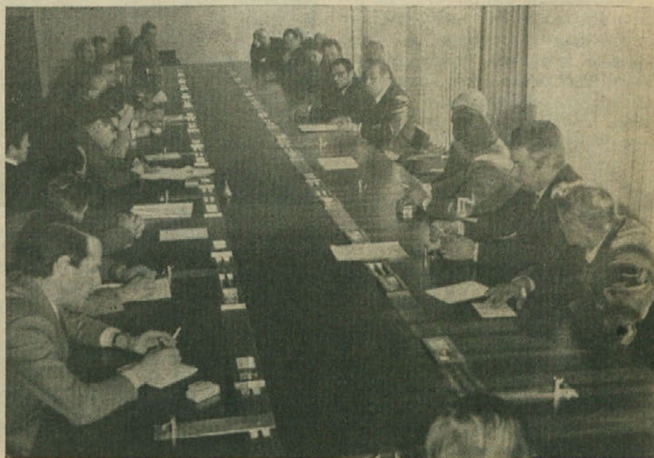
Delegacija Kraševcev na razgovoru s predsednikom deželne vlade.