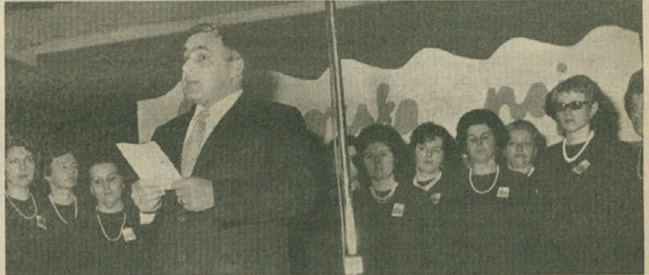
Zborovska revija v Gorici.

Obeta se torej prijeten kulturni užitek, ki ga ljubitelji zborovske pesmi ne bi smeli zamuditi!