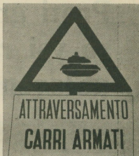
Značilni napisi na kraških gmajnah.

Neglede na to, kdaj in kako so bila izražena stališča, velja poudariti, da se Slovenci in z njimi vsa levica (KPI in PSI) ne strinjajo s predloženim zakonskim osnutkom. Treba ga bo korenito spremeniti, odpraviti določila o razlastitvah, ki so nesmiselna, upravo kraških rezervatov pa predati skupnosti kraških občin, se pravi «gorski skupnosti za Kras». Naj slovenski župani in demokratično izvoljene uprave ščitijo kraške značilnosti, spoznamo z ljudmi, lastniki in poljedelci. V nasprotnem primeru ne bo zaščite Krasa, kajti ni mogoče načrtovati in ščititi ozemlja, če se prizadeto prebivalstvo s tem ne strinja. Prepričani smo, da bi pa Slovenci sodelovali s svojimi izvoljenimi predstavniki v trenutku, ko bi jim bilo jasno, da jim nihče ne streže po življenju in možnosti razvoja. To je pa v bistvu osnovni predlog KPI. Za to naj se ustvari enotnost ljudi s Krasa. Treba je namreč prepričati vodilni skupini Krščanske demokracije, da bi se preko tega načrta polastila oblasti na našem področju. Za tisto oblast ji gre, ki je ni nikoli pridobila po demokratični poti, z volitvami.