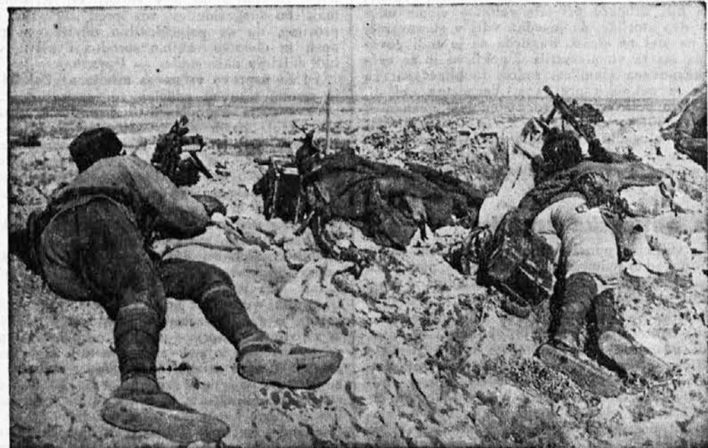
Italijansko strojniško gnezdo ob libijsko-egiptski meji.

Z nekaj potniki sem gledal na očarljivo igro valujočega morja 700 metrov pod nami. Videli smo v temi samo krog, ki so ga raz-