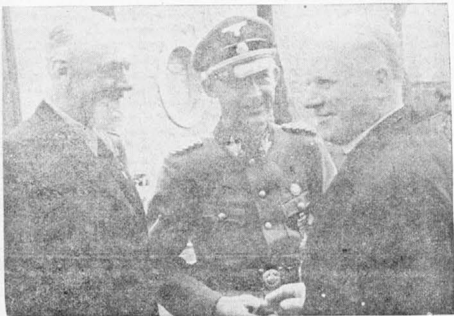
General Rupnik in škof Rožman se posvetujejo z nemškim generalom Rösenerjem za skupno borbo proti narodno-osvobodilni vojski.

Predlagam, naj bodo vsi obtoženci kaznovani v smislu čl. 4 istega zakona v zvezi z Zakonom o vrstah kazni.