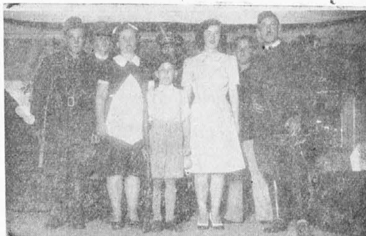
Igralci, ki so nastopili v igri "Partizanska špijonka"

Ob koncu je tudi omenil o skupnosti med našimi društvi, da te nismo še dosegli, ker