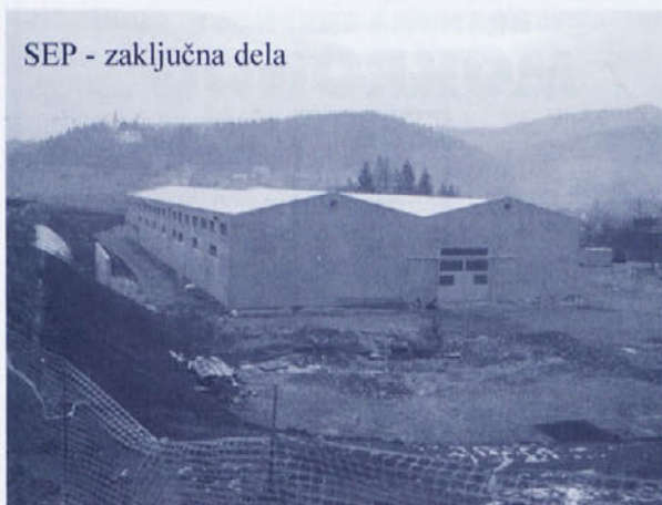
SEP - zaključna dela