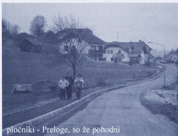
pločniki - Preloge, so že pohodni