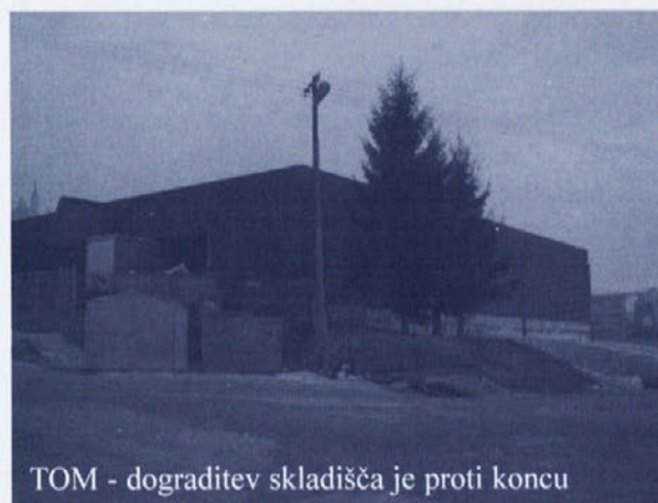
TOM - dograditev skladišča je proti koncu