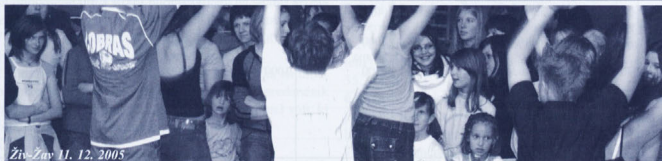
Živ-Žav 11. 12. 2005