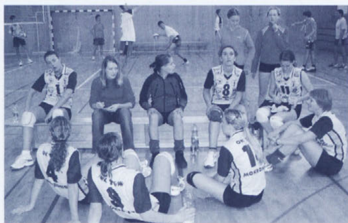
Kadetkinje na treningu na Mirni