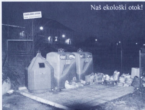
Naš ekološki otok!