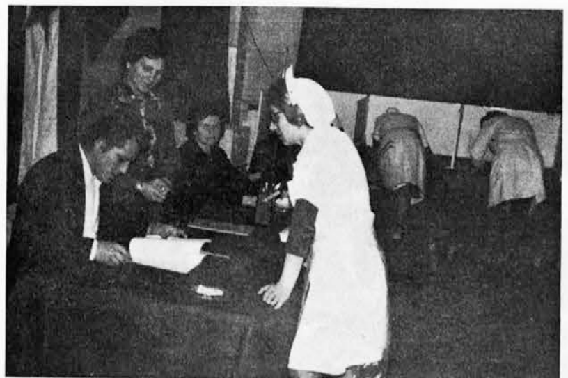
Iris — volitve