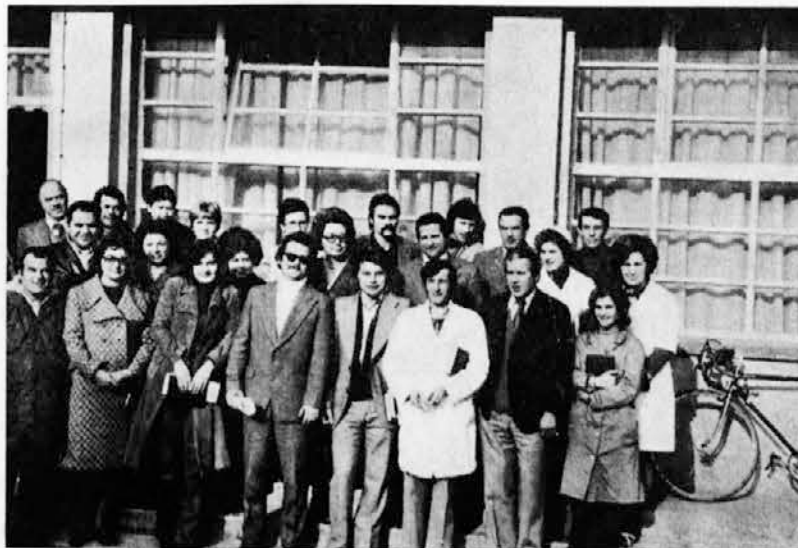
Člani CDS ob začetku mandata