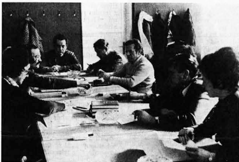
Člani odbora za pravice iz dela

Za vse sprejete sklepe, bodisi na CDS ali odborih, izda tajništvo samoupravnih organov potrebno število sklepov. Vse sklepe dostavimo glavnemu direktorju, ki je po statutu zadolžen za njihovo uresničevanje, ustreznim strokovnim službam in vlagatelju s čemer je obveščen o rešitvi vloge. V primeru, da sklep ni izpolnjen, se urgira rešitev pri določeni strokovni službi in se o izvršitvi poroča na naslednji seji organa.