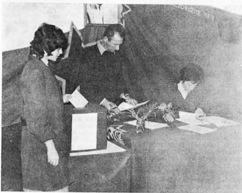
Pločevinka — volitve

V TOZD Riba je po pošti glasovalo 14 volilcev, v TOZD Avtotransport 6 volilcev, v TOZD Pločevinka 2 volilca in v samoupravni skupnosti Strokovne službe je po pošti glasovalo 42 volilcev.