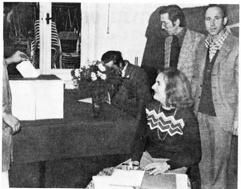
Vzdrževanje — volitve