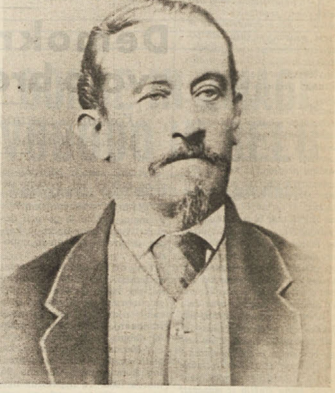
Fran Levstik, veliki slovenski kulturni revolucionar. Zaradi svojega nepopustljivega značaja ni mogel dobiti državne službe. Pruskojo za sprejem v službo so mu odbili z besedami: "Pogine naj pes!"

V njem se srčno bori za slovenske pravice in napada vlado v taki meri, da ta list prepove. V njem je izhajal njegov "Deseti brat", ki ga pa ni dovršil. Levstik postane nato tajnik "Slovenske Matice", se poglablja v delo za pripravo slovensko-nemškega stavarja in izda Prešernovo pesni.