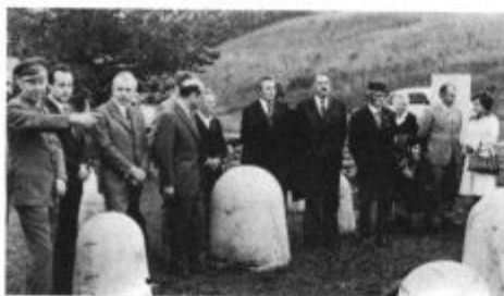
Črnogorska delegacija na Vojšici