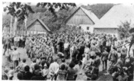
Otvoritev spomenika pri Mrzlikarju