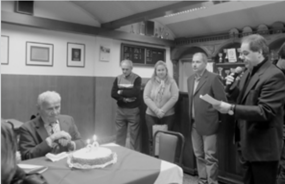
Zvestemu članu pozdrav in torta