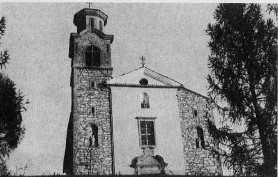
Cerkev v Marijinem Celju