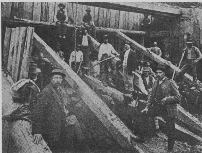
Delavci pri obnavljanju Gruberjevega kanala leta 1910