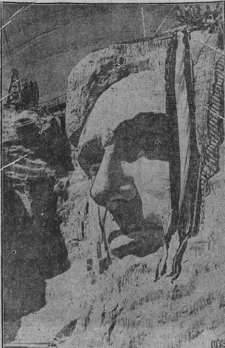
V takozvanem "svetišču demokracije" na gori Mount Rushmore, blizu Rapid City, So. Dak., je bil nedavno slovesno odkrit ogromen obraz Abrahama Lincoln, vklesan v granitno skalo. Višina od brade do temena meri 66 čevljev. V bližini sta v to goro vklesana podobna spomenika tudi Washingtonu in Jeffersonu.