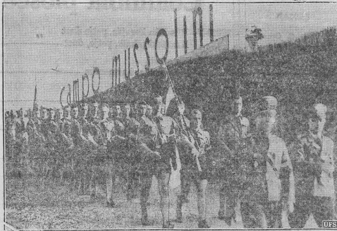
Veliko taborišče blizu Rima, prirejeno za vežbanje fašistične mladine, so nedavno obiskali nazijski dečki iz Nemčije in gornja slika jih kaže na ogledu po tem prostoru.