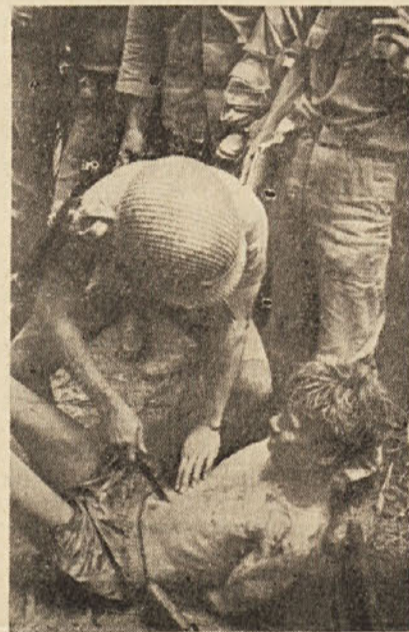
Grozodejstva ameriških agresorjev in njihovih pomagačev v Vietnamu. Ujetega partizana mučijo ker noče ničesar izdati. Vsak komentar je odveč

Ob tem bi morda kdo želel, da (Nadaljevanje na 3. strani)