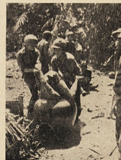
Taka je «civilizacija» agresorjev! Toda o njej radio in buržoazni tisk ne poročata

V tej vojni je bistvene važnosti ljudska iznajdljivost, ki je pomagala tudi v dolgi vojni proti Francozom. Vsaka stvar lahko postane v