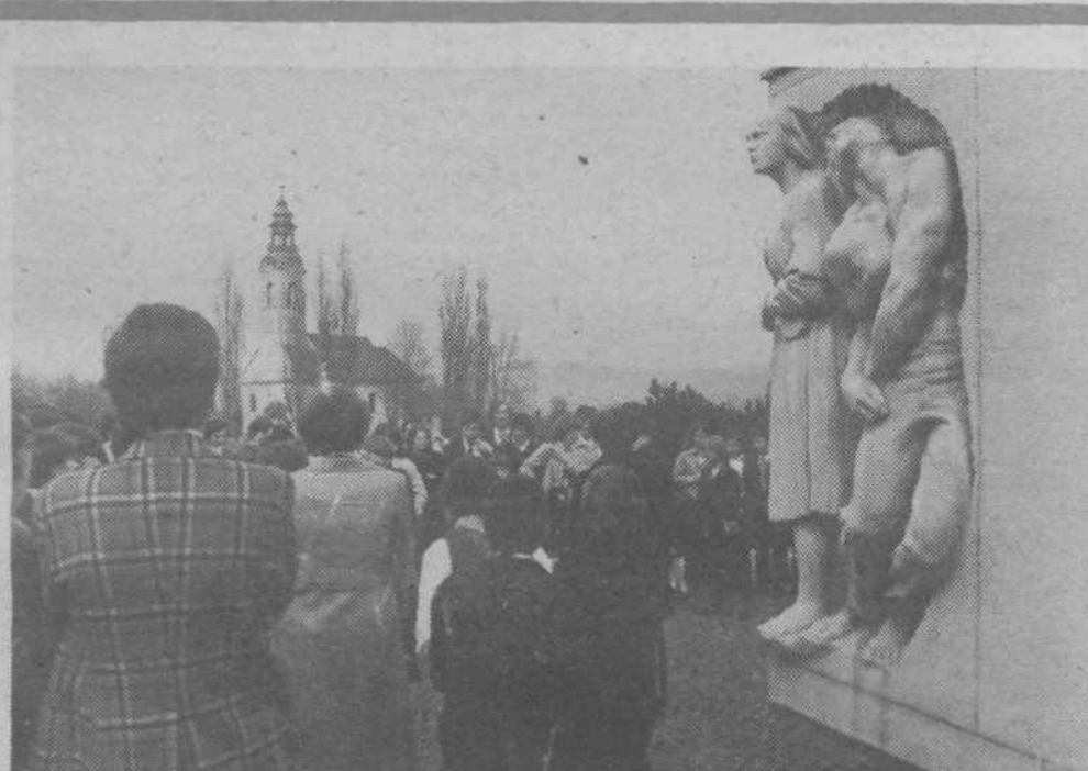
Spomeniški kompleks na Urhu je pogosto množično obiskan

potrdili pa so tudi ocene, ki so jih izrekli omenjeni referati. V razpravo sta posegla tudi Ivan Milutinović in Tito, ki je v imenu CK KPJ izrazil pozitivno mnenje o stališčih in ocenah, izrečenih na konferenci, o doseženih uspehih in rezultatih dela SKOJ na terenu. »Vendar naj vse to organizacije SKOJ ne uspava, ampak naj jih še bolj spodbuja k poglobljenemu delu, saj prav v tem zunanem in notranjem političnem položaju stojijo pred mladino še velike naloge.« Ko je Tito govoril o odnosu SKOJ in KP, je ponovil stališče, da mora biti SKOJ neodvisna organizacija komunistične mladine, ki jo v soglasju z usmeritvijo partijskega vodstva vodi SKOJ, na drugi strani pa da je dolžnost partijskih organizacij SKOJU pomagati in nadzorovati uresničitev usmeritve KP. Na koncu so na konferenci sprejeli resolucijo, s katero po-