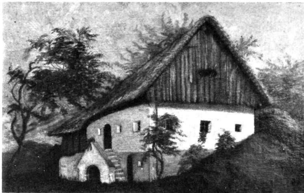
ROJSTNA HIŠA PISATELJA IVANA TAVČARJA V POLJANAH.

je bila dokaj prostorna kmečka hiša z veliko lončeno pečjo, iz hiše na levo pa je bila že napol v zemlji kamra z zamreženimi okni, ki je služila za spalnico. Leva stran poslopja je bila lesena s hlevom in skednjem nad njim. Okrog hiše je bil v bregu zasajen sadni vrt z visokima mogočnima hruškama »répnico« in »prisédovko« pred hišo, ki sta vesili svoje košate veje na njeno streho. Po hribu nad hišo pa se je razprostiral gozd z mogočnimi hrasti in kostanji. 47