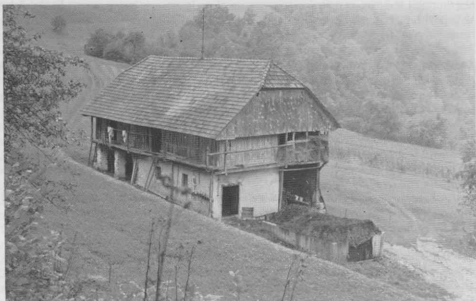
Hlev s skednjem, postavljen po požaru 1901