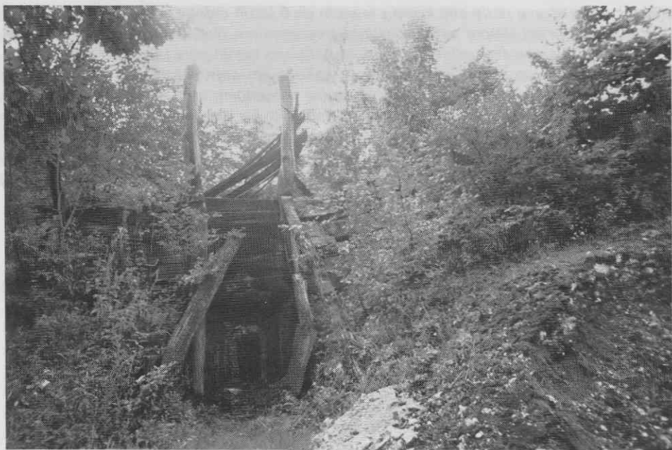
Ostanki Lapove apnenice ob Bistrici

t. VIII. zakona o sodnih taksah na din ..... 3.825.— beri: tritisočosemstodvajsetpetdinarjev.