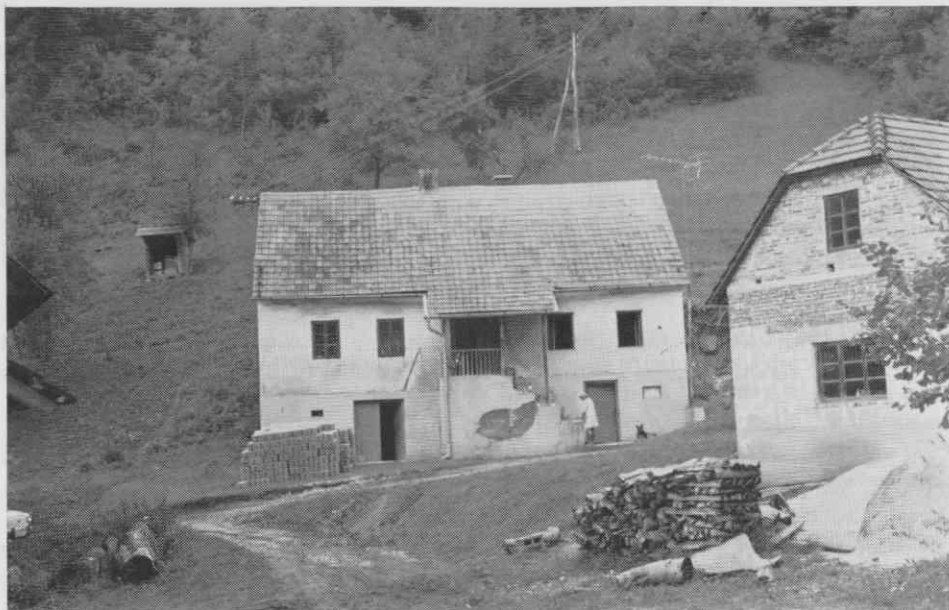
Rojstna hiša Titove matere l. 1977 (levi del je bil dozidan l. 1906)