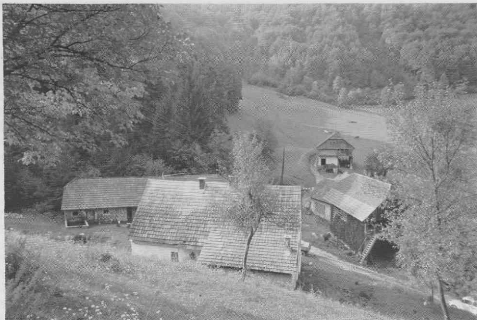
Domačija z zahodne strani