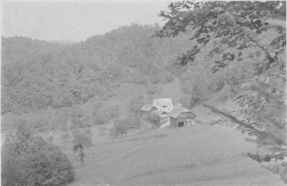
Domačija z vzhodne strani (spredaj hlev)

davčni občini Podsreda in Trebče ležeče, v prvi občini iz stavbnih parcel obstoječe nepremičnine št. 196 in 197 in iz zemljiških parcel obstoječe nepremičnine št. 1560, 1561, 1562, 1563, 1564, 1565, 1566 a in 1566 b, 1567, 1568, 1569, 1571, 1575, 1576, 1577, 1578, 1570, 1572 a, 1572 b in 1573 v skupni približni površinski izmeri 40 oralov in 204 kvadratnih klafter 10 in v čistem donosu 37 gld. 12 1/4 kr., nato v zadnji občini iz zemljiških parcel št. 435, 436 in 437 obstoječe realitete v približni površinski izmeri 1287 2/4 kv. klafter in s 7 gld. 19 kr. čistega donosa, z vsemi na njih stoječimi stanovanjskimi in gospodarskimi poslopji in kletmi in v njih se nahajajočim mrtvim inventarjem, nato eno tele, za obojestransko dogovorjeno predajno vsoto v znesku 600 gld. avstrijske veljave, reci šest sto goldinarjev a.v., v nepreklicno in neomejeno last z dovoljenjem, da postane takoj lastnik tega imetja in da se izvrši prepis gornjih realitet v zemljiški knjigi na ime prevzemnika: Martin Javeršek.