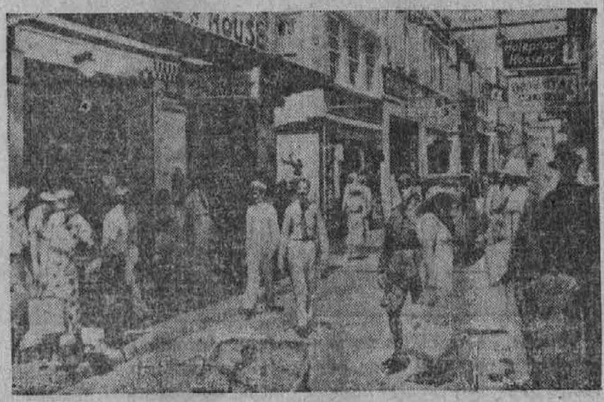
Prizor na ulici mesta Willenstad, glavnega mesta otoka Curacao, ki je v posesi Holandije in ki leži ob obali Venezuele. Na sliki vidimo več ameriških vojakov, ki se zdaj nahajajo tam.