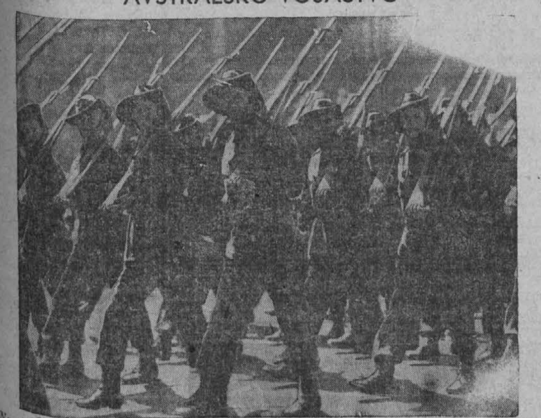
Na sliki vidimo odred avstralskega vojaštva, ki se bori na Daljnem vzhodu proti Japoncem.