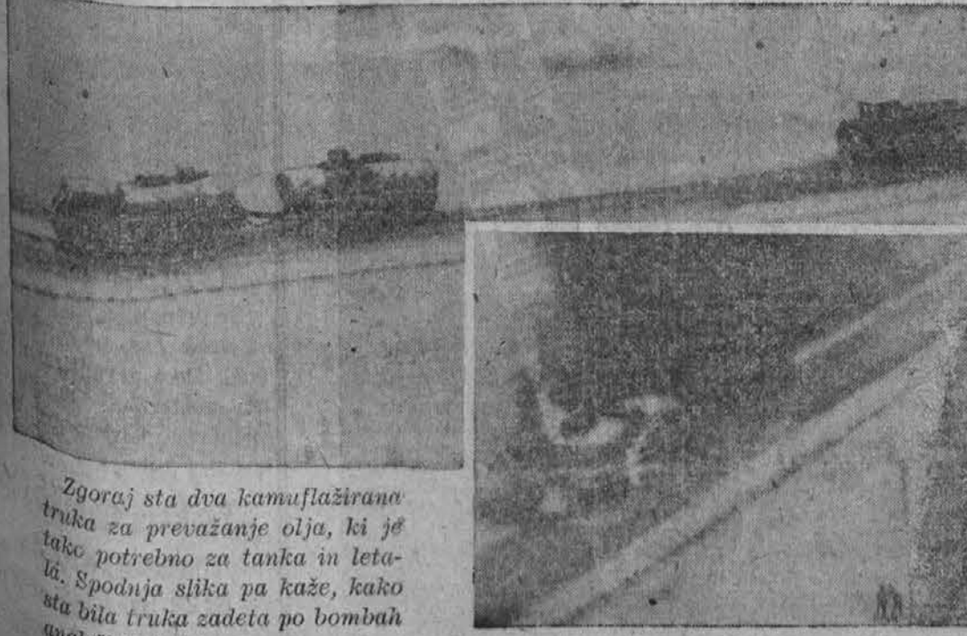
Zgoraj sta dva kamuflažirana truka za prevažanje olja, ki je tako potrebno za tanka in letalca. Spodnja slika pa kaže, kako sta bila truka zadeta po bombah angleških letalcev.