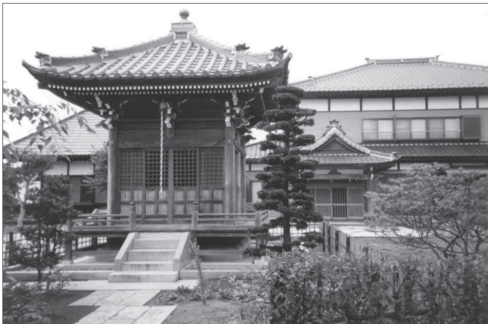
Slika 1: Svetišče in hiša na budističnem pokopališču blizu mesta Kashiwa (prefektura Chiba). Na gradnjo budističnih stavb je zelo vplival kitajski slog gradnje.

Ključne značilnosti te definicije so ideal kontinuitete in prenašanje nekaterih oblik dragocene lastnine (ime, zemlja, nazivi, svetost, tudi nadnaravne sposobnosti) in strateško črpanje iz » jezika bližnjega ali daljnega sorodstva« (vključno z uporabo izmišljenega sorodstva, da bi preprečili izumrtje »hiše«).