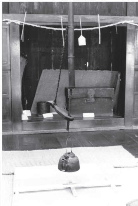
Slika 2: Ognjišče v muzejski hiši.

mizo zelo malo prostora za sedenje, so poglobili del tal, da je bil nižji od drugega dela, v luknjo so položili bibachi , v prostor okrog njega pa so položili noge in tako so sedeli kakor za visoko mizo. Nastala je t. i. borigotatsu (miza z v tla poglobljeno žerjavnico). Ko takšna miza ni v rabi, se lahko umakne, luknja se prekrije in soba je pripravljena za druge dejavnosti [Yagi 1982: 68].