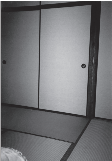
Slika 5: Fusuma – drsna vrata, ki delijo sobe (foto: N. Visočnik, 1999).

Za razsvetljavo ponoči so najprej uporabljali sveče na železnih svečnikih. Sveče so bile narejene iz rastlinskega voska in s papirnatim stenjem. Najpogostejši prenosni svečnik se je imenoval te-shoku , bil je železen s tremi nogami in široko ploščo, kamor se je stekal vosek, in z obročem, ki je držal svečo. Fosforne vžigalice so prišle v uporabo šele v meijshkem obdobju, do takrat pa so uporabljali kresilne kamne [Kashiwaki 2002: 32–41]. Pozneje so začeli sveče in posodice z oljem zakrivati s papirjem in tako je nastal andon . Andon je