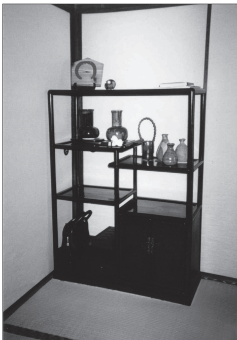
Slika 6: V sobah (hiša družine Ishiji v Kashiwi) so stvari shranjevali tudi na policah tana , na katerih so prostor našle vaze, okrasni predmeti in knjige.

V tradicionalnih japonskih hišah naj bi bilo zelo malo pohištva. Seveda so morali stvari nekam pospravljati. Za shranjevanje futonov , oblačil in podobnega so imeli vgrajene omare z drsnimi vrati, osbiire . Drugo pohištvo naj bi se bilo razvilo iz majhnih, nizkih in štirikotnih škatel za shranjevanje. Trgovci in kmetje so postajali premožnejši v edskem obdobju. Z začetkom 19. stoletja naj bi se povečalo povpraševanje po večjem pohištvu, ker majhne škatle za shranjevanje niso več zadoščale. Tako so se razvile skrinje ( tansu ), ki so bile oblikovane glede na funkcijo: kuhinjska skrinja, kusuri dansu (skrinja za zdravila), futo dansu (skrinja za pisanje) s predali za črnilo in čopič, funa dansu (ladijska skrinja), ki je bila obtežena zaradi zibanja ladje. Skrinje so vseh oblik in velikosti, narejene iz lesa in ojačene z železom, ročaji in obrobe so bili iz platine. Velike omare v hišah, pokrite z drsnimi vrati, so uporabljali za shranjevanje posteljnine in futonov . V omare tansu s predalniki, nizke omarice in predalnice pri nišah pa so spravljali majhne stvari, npr. svetilke, posodice, vaze, zvitke, kadila itn. V kuhinji, ki je bila pogosto kombinirana s spodnjim delom stopnišča, pa so spravljali stvari v omare pod stopnicami. Na hodnikih so bile lahko tudi majhne omarice za sandale geta [Katoh 1990: 46].