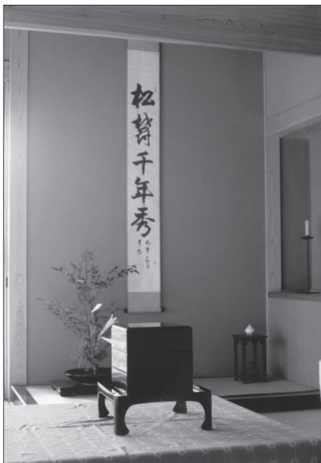
Slika 3: Tokonoma z zvitkom, ikebano in škatla s hrano – bentoubana.

Dnevna soba se je uporabljala tudi kot spalnica ( sbinsbitsu ), kar izključuje trajno namestitev postelj. Vsako noč so iz omare potegnili tanke žimnice ( futon ), rjuhe, odeje in majhne trde blazine in vse to namestili na tatami . Za shranjevanje so uporabljali vgrajene omare osbiire , police zraven tokonome ali pa predale pod stopnicami. Pokriti so bili z odejo, pod glavo pa so imeli blazine ( makura ). To so bile lahke zaprte lesene škatle, na katerih je bila pritrjena majhna blazinica v obliki valja, polnjena z ajdovo lupino. Blazine so bile tako visoke, da je na njih počivala glava, ramena so bila na tleh. To je omogočilo pretok zraka pod vratom, saj naj bi te blazine bile najbolj v uporabi v obdobjih, ko so tako moški kot ženske nosili visoko spete frizure. Drugače pa so prevladovali nizke majhne in trde blazine, prešite z blagom in polnjene z ajdovo ali sojino lupino [Morse 1972: 211–212].