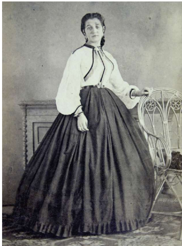
Slika 1. Damski portret, okrog 1865, iz fotografskega ateljeja Josefa Divišovkega v Ljubljani, last Narodnega muzeja Slovenije

devetnajstega stoletja že lahko šolali na tečajih v Cesar-skokraljevem tehnološkem obrtnem muzeju in Vzorčni delavnici za pletarstvo na Dunaju in pozneje pogosto poučevali na popotnih tečajih po ožji in širši avstrijski domovini. V teh in naslednjih letih se je v slovenskem prostoru v kombinaciji s profitnimi delavnicami odprlo nekaj pletarskih šol in pletarskih oddelkov na lesnih šolah. Na zasebni nemški Strokovni šoli za lesno industrijo v Kočevju so imeli med letoma 1887 in 1897 pletarski oddelek in izdelovali tudi pohištvo, stojala za note, koše za papir in košarice za ročna dela, stojala in koške za rože. V furlanskem Vidmu je od leta 1889 obstajala Furlanska družba za