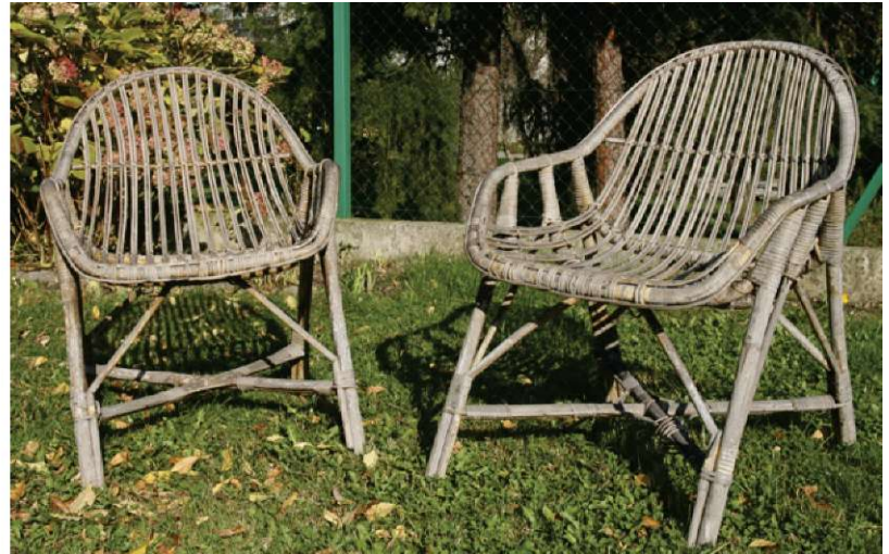
Slika 8. Naslonjača, šestdeseta leta, sodobna forma, zasebna last