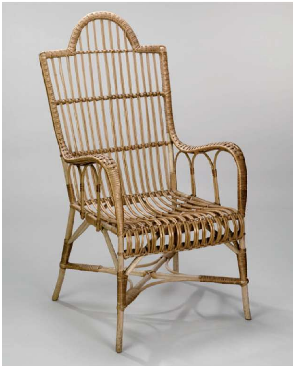
Slika 3. Naslonjač na gradu Tuštanj, začetek 20. stoletja, secesija, zasebna last

Po drugi svetovni vojni so pohištvo pletli v zaporih, na primer do okoli leta 1960 v Tolminu. Na Ptujju je v petdesetih in šestdesetih letih delovalo državno podjetje Pletarna, ki je izšlo iz predvojne ptujske šole in zadruge in katerega sto trideset delavcev je iz vrbovega protja iz lastnih nasadov med drugim izdelovalo zibelke, sodobne fotelje, mizice in vrtno garniture. Pleteno pohištvo so po vsej Sloveniji izdelovali posamezniki, največ v savski dolini in na Ribniškem, ki so se bili izučili pri prvih generacijah absolventov pletarskih tečajev, šol in delavnic. Svoje izdelke so prodajali v trgovinah državnega podjetja Dom. V Stražišču pri Kranju je iz delavnice Valentina Tepine izšel pletar Oto Jereb, ki je deloval do sedemdesetih let. Izdeloval je posteljice za dojenčke, mize in naslonjače. Vedno bolj so slovenski trg pletenega pohištva prevzemali izdelki iz hrvaškega Zagorja in bosanske Posavine. Pleteno sedežno pohištvo je bilo bodisi še vedno klasičnih angloameriških oblik izpred prve svetovne vojne, v naravnih tonih ali živo pobarva-