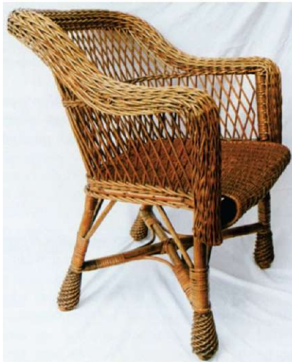
Slika 7. Naslonjač, izdelek Ota Jereba v Stražišču, šestdeseta leta, angloameriška forma, zasebna last