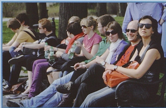
Zgoraj: ogled Bratislave.

pusti v udeležencih prijetno počutje in voljo do zabave, ki se zadnji večer nadaljuje do sončnega vzhoda, pozdravov, smeha, solz in sladko grenke poti domov.