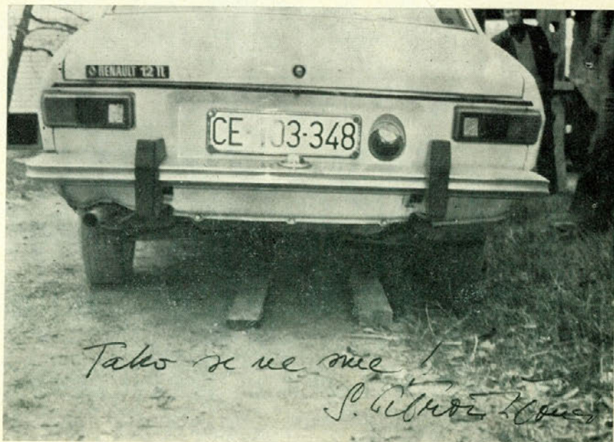
Takšna nespretnost lahko ima hude posledice

stom. Pri tehničnem pregledu, ki je sestavni del tekmovalnih disciplin, mu namreč ni gorela ena od žarnic za osvetljevanje registerske tablice, kar mu je prineslo pet kazenskih točk. Sicer pa zasluži tov. Grabler vse priznanje in pohvalo, saj se kljub svojim 53. letom, redno udejstvuje pri vseh akcijah, ki