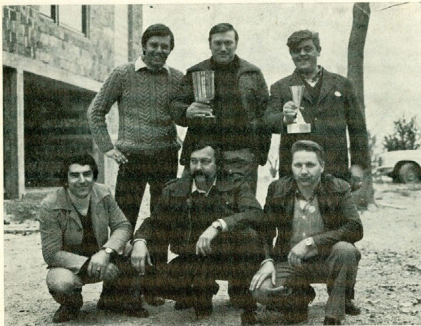
Zmagovalna trojka s sovozniki