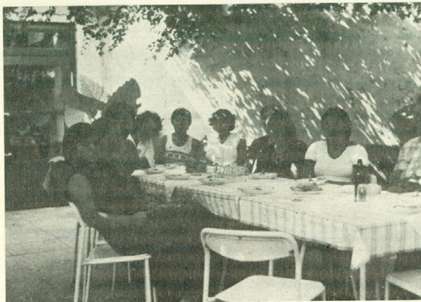
Kolektiv Počitniški dom, ki je stregel gostom

Iz gornjega pregleda je razvidno, da so bile nočitvene kapacitete polno zasedene le v IV. in V.