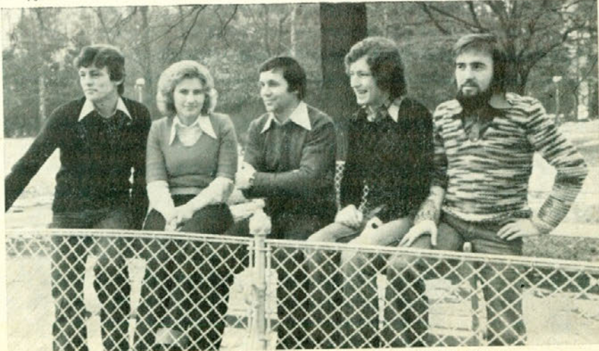
Zabavno glasbeni orkester »Flamingi« iz Maribora