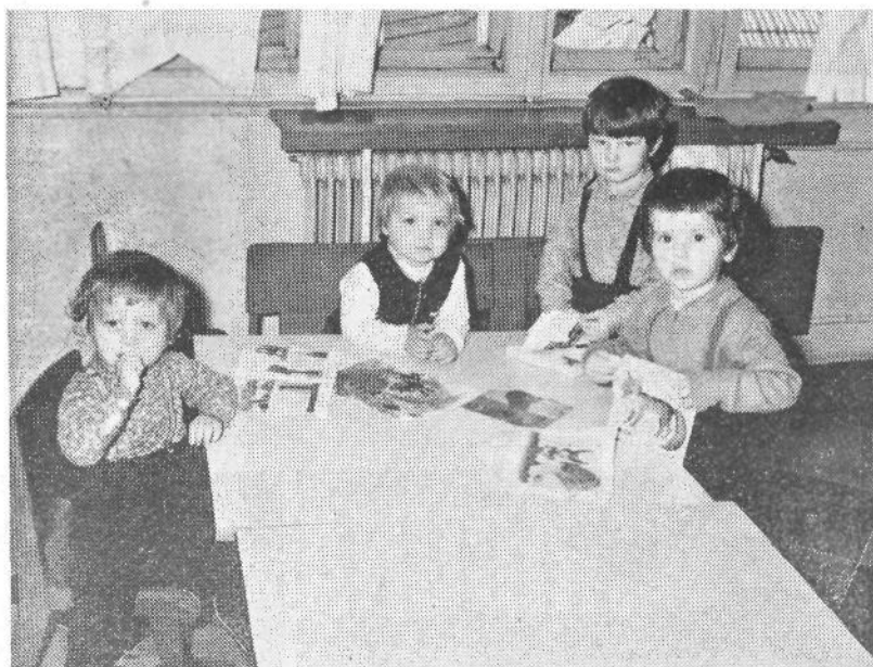
Majhni smo in utesnjeni v vrtcu Rezke Dragarjeve v Šentvidu