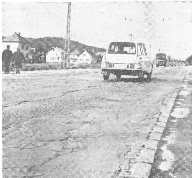
Kdaj bom štiripasovnica?

Za vzdrževalna in druga dela so v letošnjem osnutku predvidena znatno manjša sredstva — indeks 52. Osnutek namreč upošteva sta-