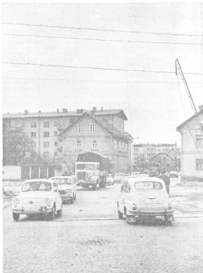
Podvozu na Samovo se še ne mudi

Proračun zagotavlja sredstva za redno dejavnost Zavoda za socialno delo. To je za osebne dohodke delavcev ter materialne izdatke. Zavod je imel lani zaposlenih 12 oseb, letos pa bo zavod zaposlil dva nova socialna delavca, kar je na predlog sveta za zdravstvo že odobrila občinska skupščina pri obravnavi letnega poročila o delu Zavoda za socialno delo. V planu za leto 1971 so redni izdatki zavoda povečani za 15,0 %, z upoštevanjem novih namestitev pa za 29,6 %.