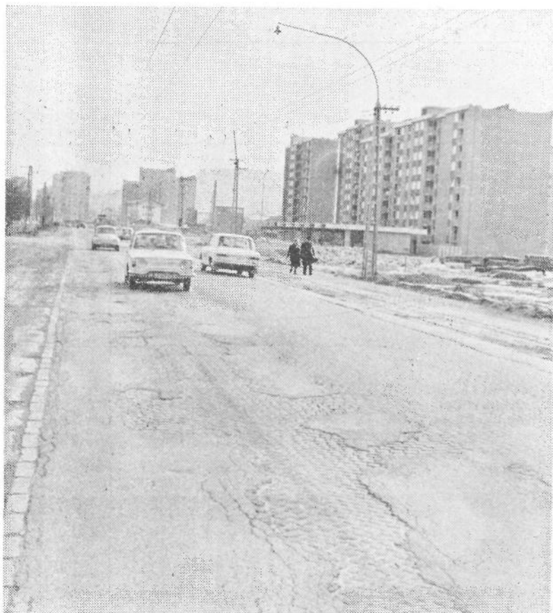
Po Celovški je furati fajn, je polno kotanj

Na podlagi istega zakona je družbeno-politična skupnost dolžna, kriti del stroškov zdravstvenega zavarovanja socialno ogroženih kmetov. Po pogodbi s skupnostjo zdravstvenega zavarovanja kmetov bo občinska skupščina plačala razliko med pobranim in odmerjenim prispevkom posameznih kmetov — zavezancev prispevka, ki zaradi socialnih razlogov obveznosti niso mogli poravnati. V ta namen je v proračunu za leto 1971 predviden znesek 250.000 din.