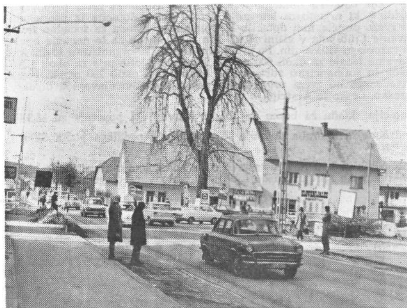
Sentvidski gordijski vozeli — Tacenska in Celovška cesta

Prispevki od osebnega dohodka so bili lani in letos planirani po stopnji 4,50%. Lani je občinski proračun prejel 1,55%, temeljni izobraževalni skup. pa 2,95%, letos pa je delitev spremenjena, tako da se v občinski proračun odvaja po stopnji 1,71%, temeljni izobraževalni skupnost pa po stopnji 2,79%. Od republike odstopljeni prispevek za otroško varstvo po stopnji 0,45% od osebnega dohodka in 0,40% od pokojnin in invalidnin v proračunu za leto 1971 še ni upoštevan. To bodo dohodki temeljne izobraževalne skupnosti in bodo predvidoma znašali: od osebnega dohodka 4.010.000 din, od pokojnin ter invalidnin okoli 360.000 din, torej skupaj 4.370.000 din. Ta sredstva bodo izkazana v proračunu temeljne izobraževalne skupnosti, namenjena pa bodo za vzdrževanje in gradnjo vzgojno-varstvenih domov.