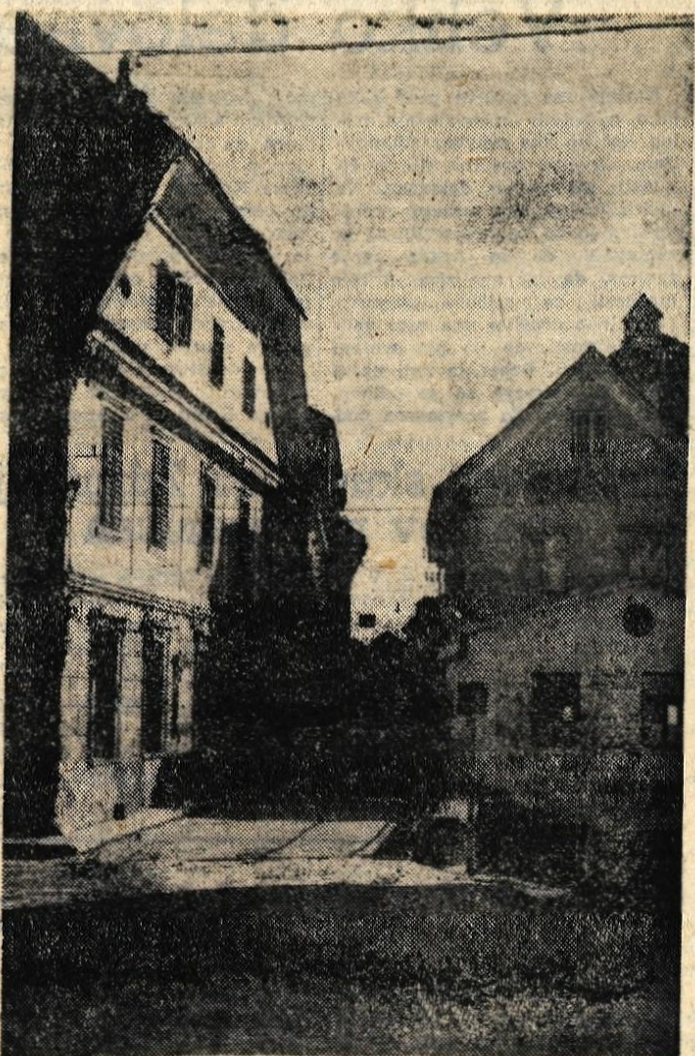
Radovljiško ozko grlo

Jesenice - V Zelezarni je v soboto opravljala izpite za kvalificiranega delavca zadnja skupina članov kolektiva - bivših borcev NOB. Delavci iz topilnic so pokazali zadovoljivo znanje in si pridobili kvalifikacijo, tako da je do sedaj v jeseniški Zelezarni izpit za kvalifikacijo opravilo 338 članov kolektiva, ki so člani ZB. U.