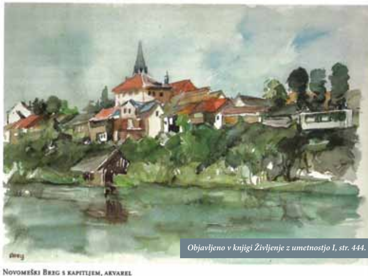
NOVOMEŠKI BRG S KAPITIJEM, AKVAREL

V našem okolju je navzven gotovo najbolj izpostavljena umetnostna zvrst arhitektura, ki pa si danes zaradi podrejanja vsega funkcionalnosti žal največkrat ne zasluži tega imena; zato na novo bolj pozitivno vrednotimo celo tisto iz 20. stoletja, ki jo danes vse