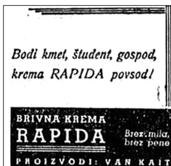
Slovenec , 7. 5. 1944