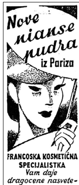
Jutra, 2. 2. 1939

Poleg oglasov za kreme so tudi oglasi za pudre potencialnim uporabnicam obljubljali srečo v ljubezni – to razberemo mdr. iz oglasa za puder Tokalon, ki pod