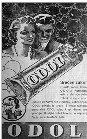
Jutro, 12. 5. 1940

V Jutru in Slovencu so oglasi za univerzalno kremo Elida ideal prepričevali s sloganom Skrbna nega – popolna lepota, 536 v Jutru pa so vabili k nakupu kreme Pegasan (proti sončnim in vsem drugim pegam – lišaju in nečisti koži), ki so jo v lončkih po 20 din prodajali v drogeriji Kanc na ljubljanski Židovski ulici. 537