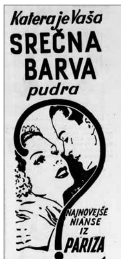
Slovenec, 7. 7. 1939