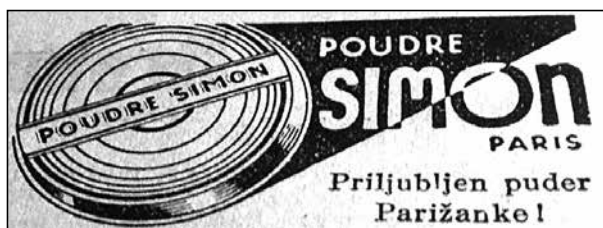
Slovenec, 5. 1. 1939

naslovom Katera je Vaša srečna barva pudra prikazuje žensko v moškem objemu. 557