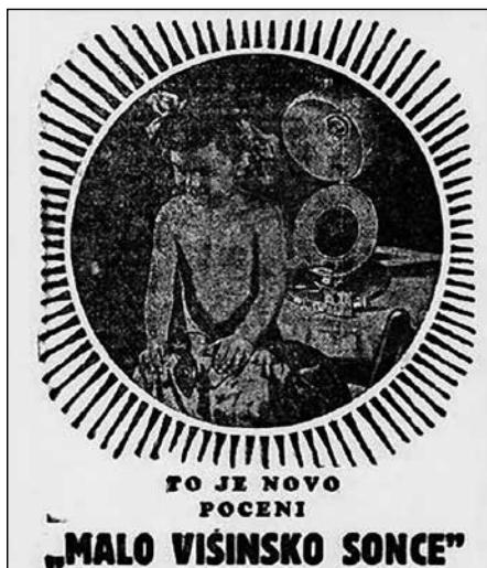
Jutro , 26. 1. 1941