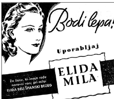
Jutro , 30. 4. 1939

za milo Elida, inserirana v obeh dnevnikih. V Slovenecu so poudarjali, da je milo, ki vsebuje ekstrakt sedmih cvetic in je dermatološko preizkušeno, »Blagodat za Vašo kožo, tudi če je še tako občutljiva.« 548 V Jutru so uporabo mila povezovali z lepoto, omembe higiene ni zaslediti. 549