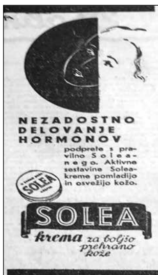
Slovenec, 13. 7. 1939

besedami: »Pod zaščito Solea – kreme, sonce, voda in veter Vaše kože ne morejo ogrožati, ampak lahko le pospešujejo njeno lepoto in zdravje.« 534 Nekateri oglasi za kremo Solea pa so izdelek povezovali z reševanjem »nezadostnega delovanja hormonov«. 535