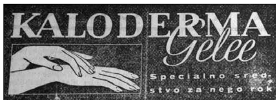
Slovenec, 11. 1. 1939

zobozdravnikov priporočajo tovrstno ustno nego, predvsem zaradi »antiseptičnega in ustne bakterije uničujočega učinka«. Ilustraciji tube je priložena fotografija nasmejanega dekleta. 541 S to fotografijo je opremljen tudi oglas, ki trdi, da »lepota, Vaša osebna privlačnost, zavisita od zdravih, svežih in lepih zob. Kolynos napravi tisoče ljudi lepše.« 542 V Jutru so oglaševali tudi sredstvo za negovanje zob Pebeco, »pjenušavi prašak za zube bez sapuna«. 543 Zelo pogosto pa je v Jutru zaslediti oglase za zobno kremo Odol, čedno in prikupno ilustrirane. Bistvo oglasov so bili sicer čisti in zdravi zobje ter krepke dlesni, vendar ni mogoče spregledati tudi podtona, npr.: »Lepota žene je v njenih zobeh. Z uporabo malo zobne kreme Odol pritegnete, milostiva gospa, poglede vseh nase, zakaj Vaši zobje postanejo beli ko sneg.« Zobna krema Odol naj bi pripomogla celo do srečnega zakona, saj »nasmejana usta z blesteče belimi zobmi mnogo pripomorejo do harmonije v zakonu. Zobna krema ODOL prinaša to srečo ...« 544