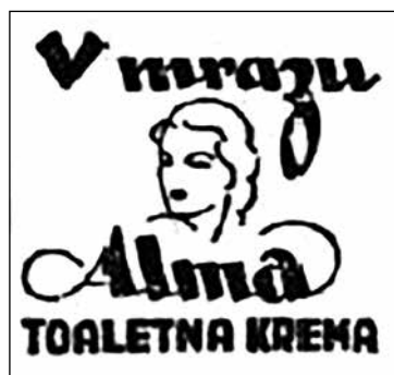
Jutro , 23. 1. 1944

Kot je v Slovincu izstopala reklama za brivsko peno Rapida, sta v Jutru izstopala oglasa za t. i. lepotno pomlajevalno peno Saxobell, ki naj bi pospeševala krvni obtok v koži ter vzpodbujala živahnejše delovanje kožnega tkiva (maj 1943), in za zeliščni šampon Alpa, ki naj bi bil vrhunec higijene, zdravja in lepote las, negoval, lepšal in krepil naj bi krhke, cepljive in od ondulacij oslABLJENE lase, za kar bi poskrbela njegova odlična sestava iz mehčalnih, antiseptičnih in za prehrano lasnih čebulic posebno važnih snovi (avgust 1943).