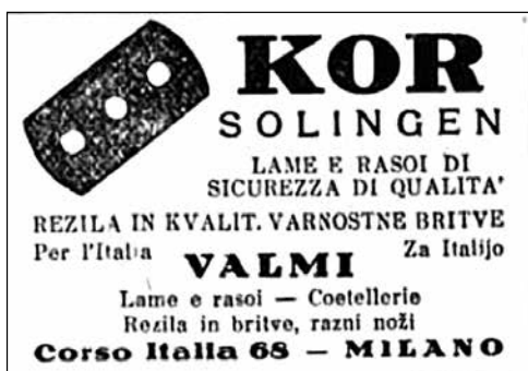
Slovenec , 21. 6. 1942