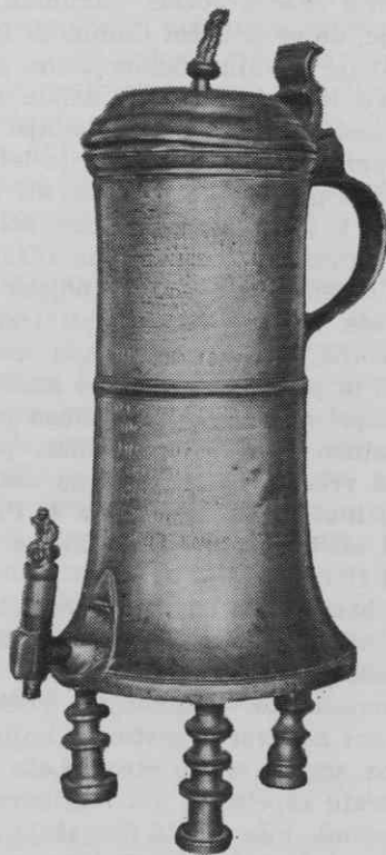
Slika 2 Cehovski vrč mariborskih sodarjev iz leta 1633, Maribor, Pokrajinski muzej

Jožef Caminolli I. je pomemben zaradi tega, ker poznamo njegova dela, ki so opremljena z mojstrsko značko. Zanj je uporabil predpisani mestni grb in mu dodal svoji iniciali I. C. V Pokrajinski muzej v Mariboru je priromalo pet skled s takšno signaturo (inv. št. N. 2974/4, N. 3026). Od skled velja omeniti ono z dvakrat stopničasto poglobljenim dnom in s pritaljenima zvitima ročajema