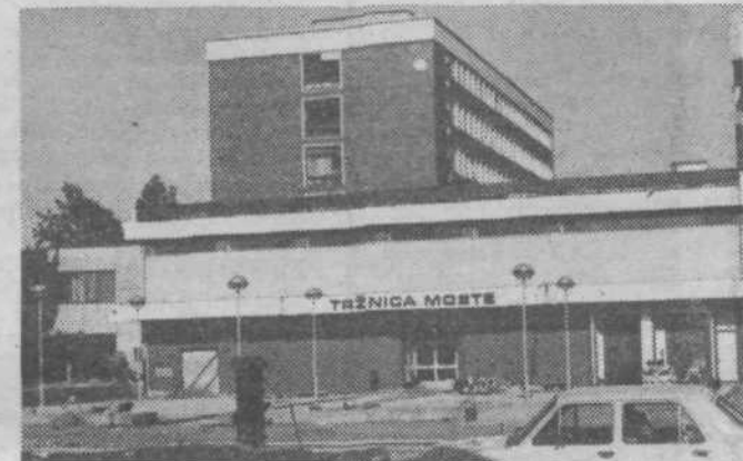
Če ne bo več nobenega če... se bodo tule čez mesec dni med prodajalci že drenalji kupci.

O prostorih bivše lekarne na Zaloški cesti št. 47 je razpravljali izvršni svet naše občinske skupščine. Občinski samoupravni stanovanjski skupnosti, ki upravlja s temi prostori, je predlagal, da jih odda Ljubljanski banki — Gospodarski banki za poslovalnico na našem področju, vendar pod pogojem, da bo v njih opravljala gotovinsko poslovanje z občani.