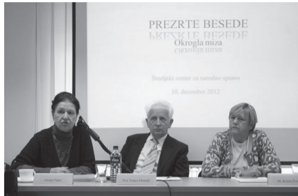
Okrogla miza »Prezrte besede«

človekovih pravic so na okrogli mizi Prezrte besede , ki jo je organiziral Študijski center za narodno spravo, udeleženci spregovorili o preganjanjih in prezrtih slovenskih literatih, ki so med drugo svetovno vojno in po njej ustvarjali onkraj slovenskih meja, njihova dela pa so bila v naslednjih desetletjih bralcem v domovini težko dostopna ali nedostopna.