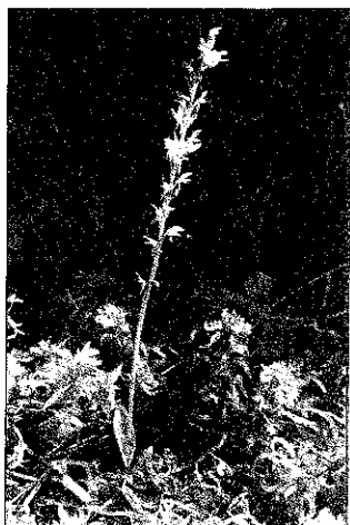
Sl. 2: Močvirska grezulja ( Hammarbya paludosa )

Ta orhideja je bila najdena na barju le na enem mestu (skupaj z blatcem in grezuljo, na sl. 1 označeno s krožcem), kjer je poleti 1990 cvetel en primerek, naslednje leto pa vsaj deset. Najdba je zelo zanimiva, saj velja ta vrsta v Sloveniji že več kot stoletje za izumrlo (Ravnik, 1975) – zadnji podatek o uspevanju na doslej edinem slovenskem nahajališču pri Bevkah je herbarijska pola, ki jo je leta 1882 nabral Voss (Wraber & Skoberne, 1989). Sicer je značilnica združb zveze Rhynchosporion albae W. Koch 26 (Oberdorfer, 1983) in uspeva predvsem skupaj s šotnimi mahovi iz sekcije Subsecundum (ibid.).