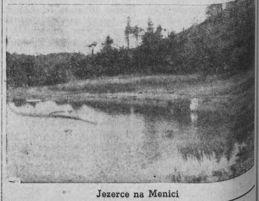
Jezerce na Menici

Naloga FZS in vseh planinstev ter alpinistov je, da s pomočjo teh značilnih panog planinstva in alpinistike, ki so posledice objektivnih pogojev razvoja, ustvarjajo možnosti za dvig planinstva bo dostopno delovnemu ljudstvu in mu bo v oporo in pomoč pri dviganju delovne obrambne sposobnosti in pri vrševanju velikega gospodarskega načrta ter ustvarjanju boljše življenja. (SANS—Chicago)