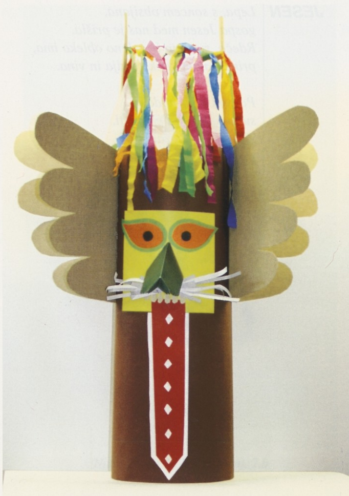
Neja Gril in Aljaž Puž, 4.a