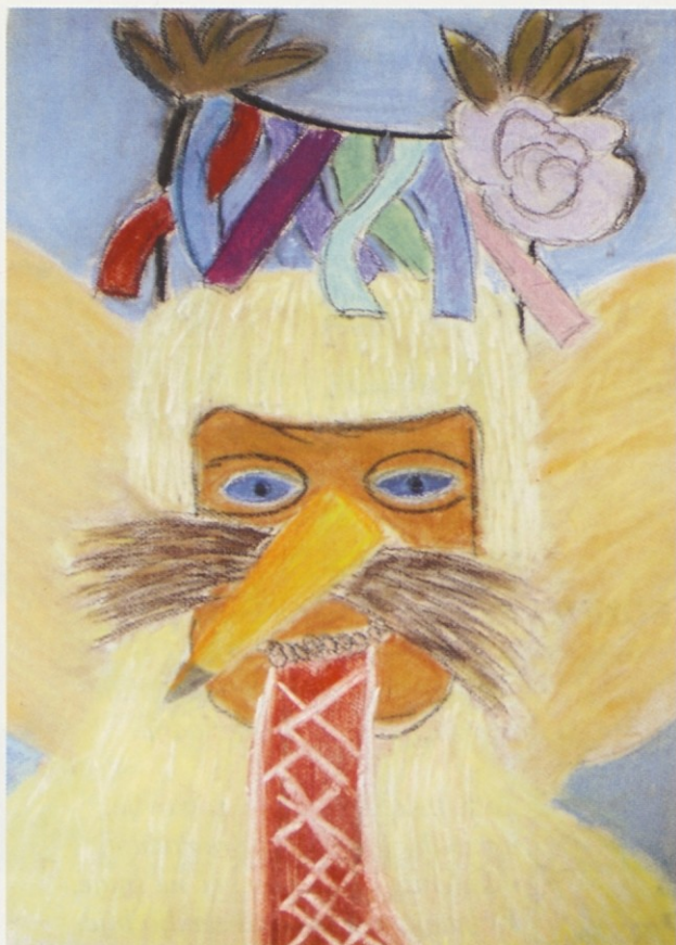
Iris Bombek, 7.b