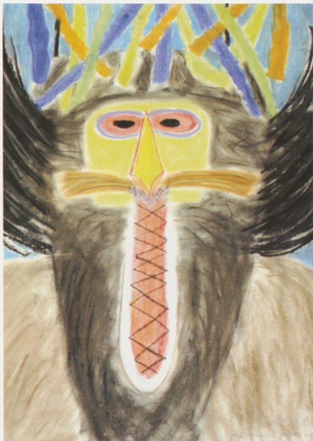
Aleks Kmetec, 8.b in Enej Krajnc, 8.a