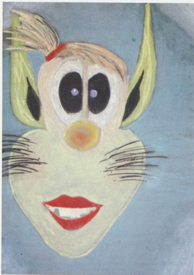
Urška Belšak in Saša Šmigoc, 9.a