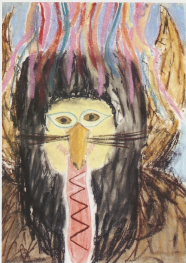
Primož Holc in Sašo Yacoub, 8.b