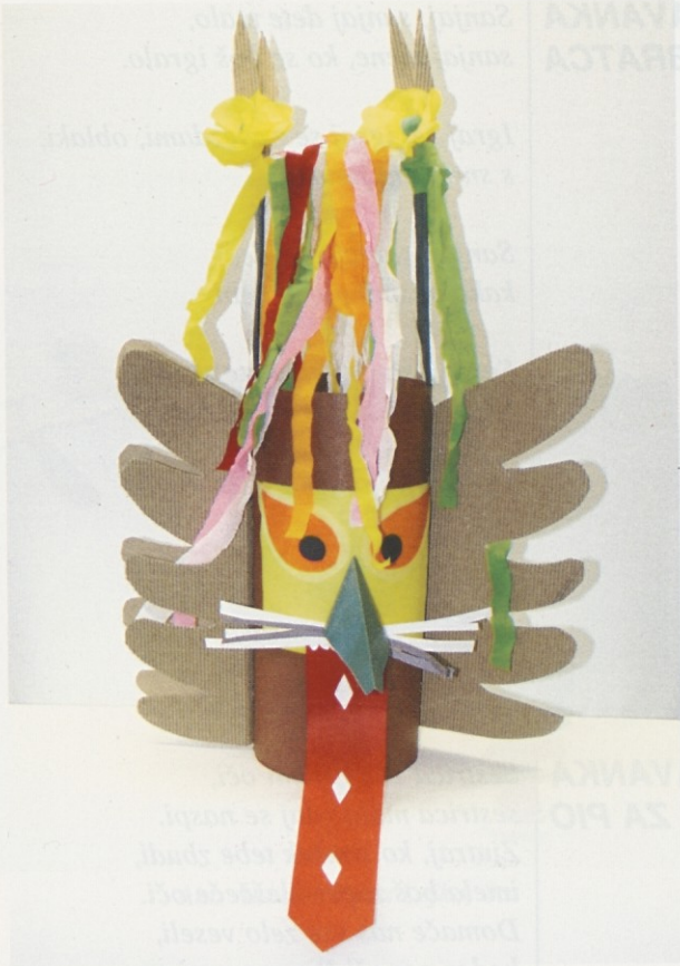
Aleks Pešič in Matija Vuletič, 4.a