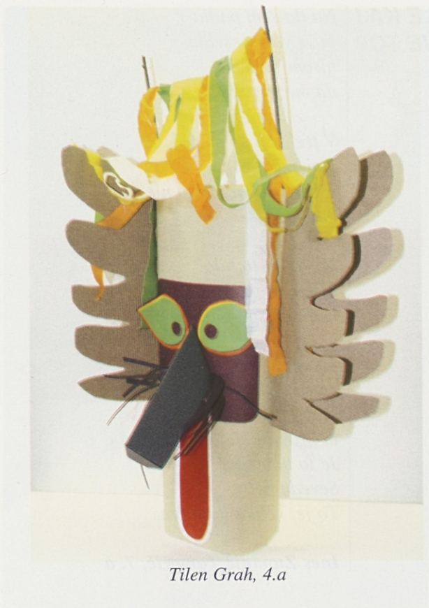
Tilen Grah, 4.a