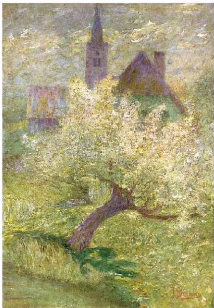
Cvetoča jablana, 1907