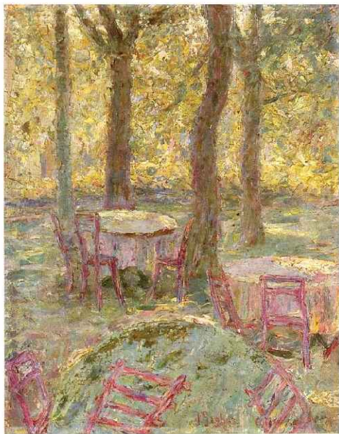
Štemarski vrt, 1907