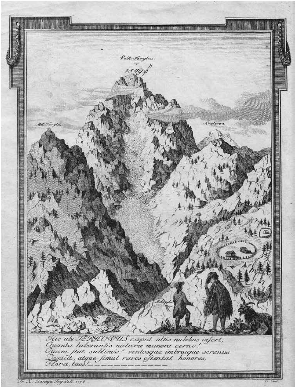
Prva upodobitev Triglava (Hacquet, Oryctographia Carniolica , 1778).