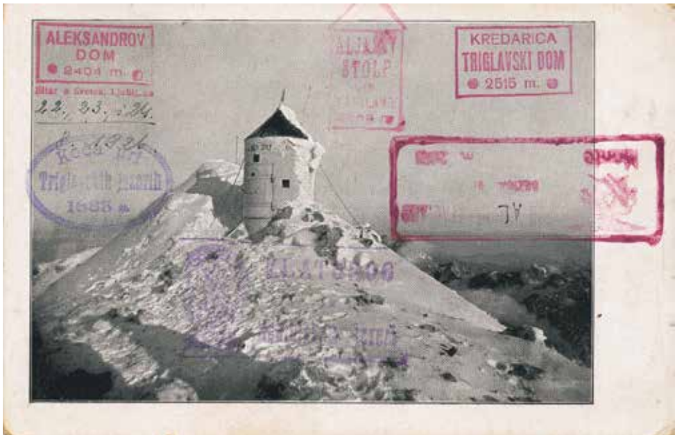
Aljažev stolp na vrhu Triglava, razglednica iz leta 1926 (založil fotograf Fran Pavlin, Jesenice).