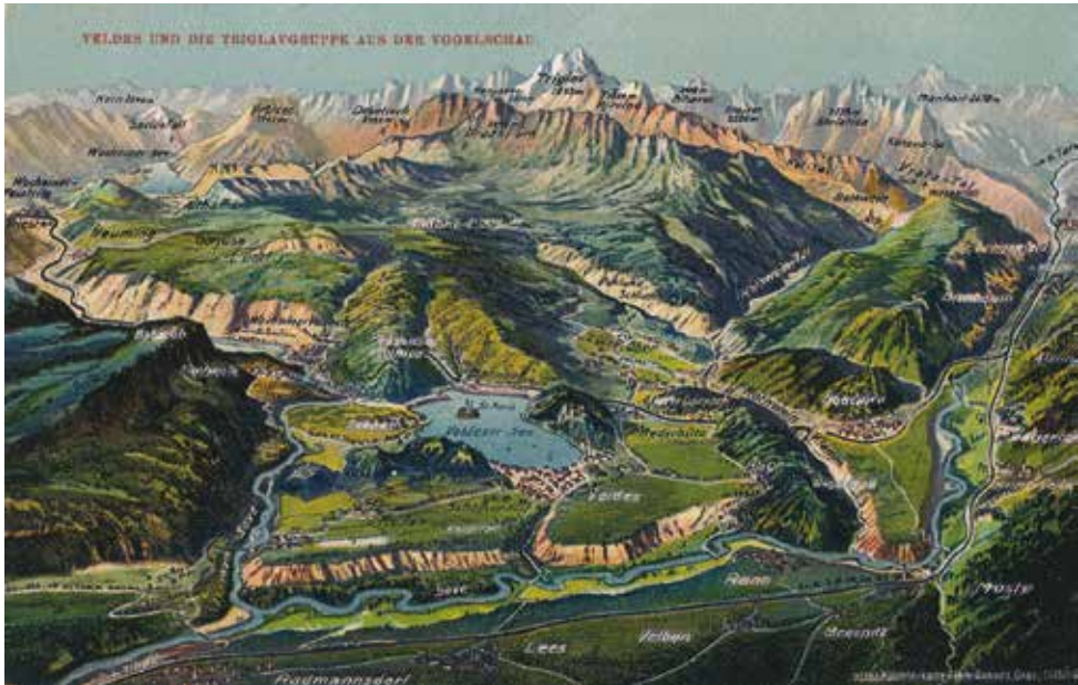
Pogled na Triglavsko pogorje, razglednica iz začetka 20. stoletja (založil Albin Sussitz, Graz).