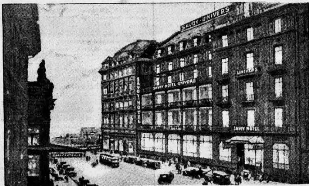
Nemčija čaka na pomoč

V Basel-u, kjer ima svoj sedež Mednarodna reparacijska banka (glej sliko!), se vrše važna pogajanja za nujno finančno pomoč Nemčiji.