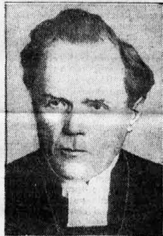
Nadškof Soederblom †.

Princ je nato odobril račun za 50 gnjati. Tudi slavni virtuoz na klavirju Padesewski je znan kot ljubitelj dobre kuhinje in z njim je vedno potoval po svetu tudi njegov francoski kuhar. Padesewski je imel navado, da je kuharja po vsakem obedu javno pohvalil, kar se je kuharju silno dobro zdelo. Enkrat pa se je zgodilo, da Padesewski ni pohvalil tudi juhe. Ves užaljen je stopil kuhar, k Padesewskemu in ga je vprašal: »Gospod, kaj bi vi rekli, če bi kritika samo 3 točke vašega programa pohvalila, četrtega pa ne?«