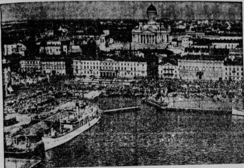
Pogled na glavno mesto Finske — Helsinkih.