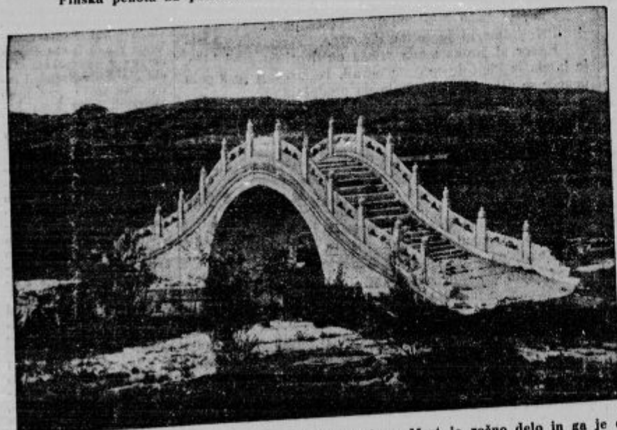
Most iz porcelana na Kitajskem — v deželi porcelana. Most je ročno delo in ga je delalo več rodov.