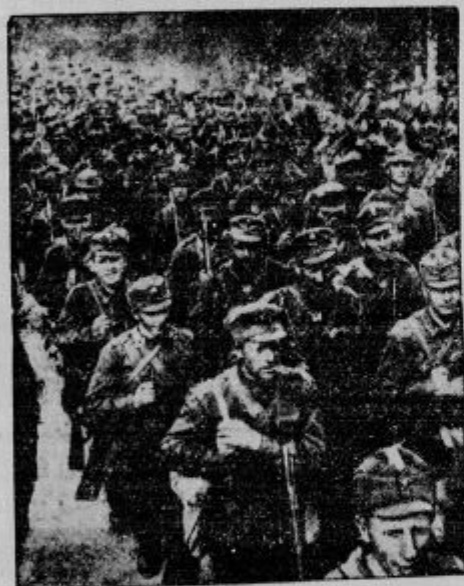
Finska pehota na pohodu.