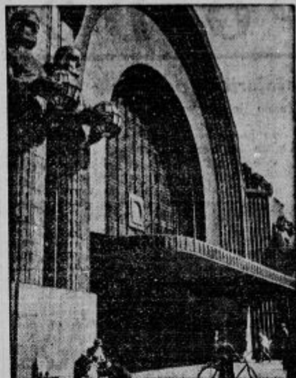
Glavni kolodvor v Helsinkih.