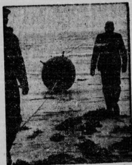
Mina na danskem obrežju. Posebni oddelki vojske jih iščejo ob obrežju, da jim odstranijo eksplozivne priprave.