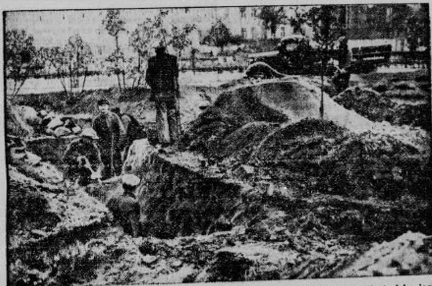
Ko se je začelo napeto razmerje med Sovjetijo in Finsko, so začeli Finci kopati strelske järke.