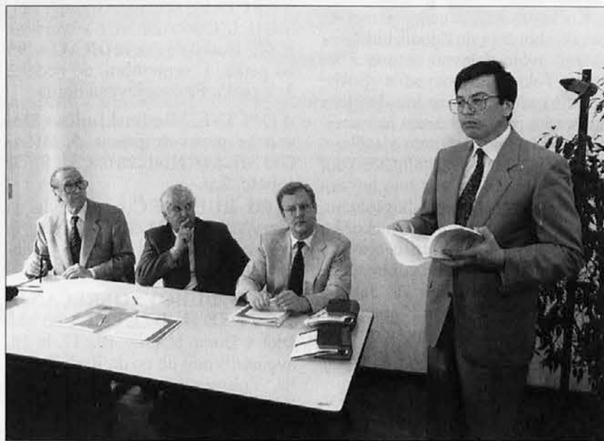
Svoj uspeh je SSK predstavila na tiskovni konferenci