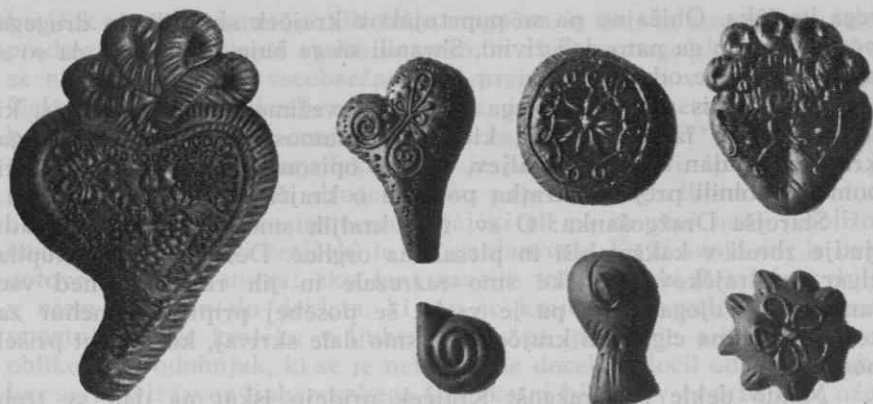
Pod. 1. Mali kruhek iz Dražgoš. Levo ukrivljeno srce (iz Železnikov?) v Etnografskem muzeju.

O teh surovih primitivnih oblikah upravičeno domnevamo, da so poslednji in redki drobci nekdanjega živalskega sveta na gorenjski pogači. In kaj predstavljajo danes vsi ti polži ali pute? Igrača otrok so in predmet šaljivosti odraslih ljudi.