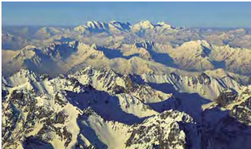
Engadinske Alpe.